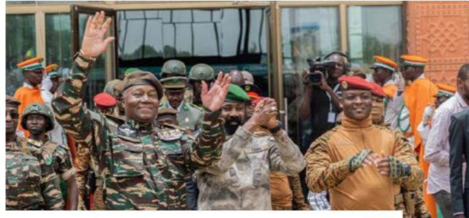
Les trois Chefs d'Etat de l'AES, le 6 juillet 2024 à Niamey.

Née le 6 juillet 2024 à Niamey de la volonté du Mali, du Burkina Faso et du Niger, la Confédération AES célèbre son deuxième anniversaire dans un contexte où ses dirigeants revendiquent une coopération renforcée. Créée moins d'un an après l'Alliance des États du Sahel, fondée le 16 septembre 2023 face aux défis sécuritaires, elle entend dépasser l'alliance de défense pour bâtir un espace d'intégration politique, économique et diplomatique. À l'occasion de cette commémoration, le Président en exercice, le Capitaine Ibrahim Traoré, a salué « une étape décisive » dans l'histoire des trois États membres. « Deux années plus tard, cette date est devenue bien plus qu'un anniversaire institutionnel. Elle symbolise désormais l'espérance d'une renaissance africaine », a-t-il déclaré le 5 juillet 2026 aux populations du Mali, du Burkina Faso et du Niger.