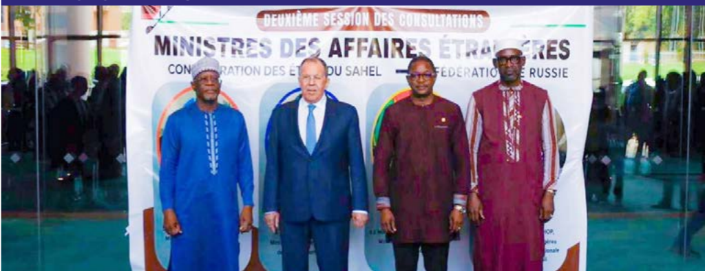
À Niamey, le 8 juillet 2026, les ministres des Affaires étrangères de l'AES et leur homologue russe posent à l'ouverture de la deuxième session des consultations AES-Russie, consacrée au renforcement du partenariat sécuritaire, diplomatique et économique.