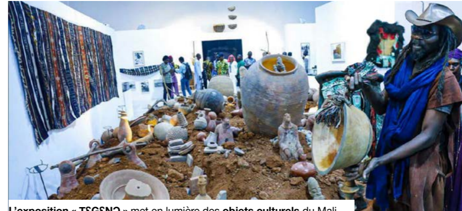
L'exposition « TÈGÈNO » met en lumière des objets culturels du Mali.

Dans la salle d'exposition, le bruit de la ville s'efface. Sous une lumière douce, les visiteurs avancent entre les vitrines, face à des pièces qui racontent plusieurs siècles d'histoire. Bijoux, statuettes, manuscrits, instruments de musique et objets du quotidien rappellent la richesse des savoir-faire, des croyances et des modes de vie qui ont façonné le Mali. Le parcours réserve aussi des décou-