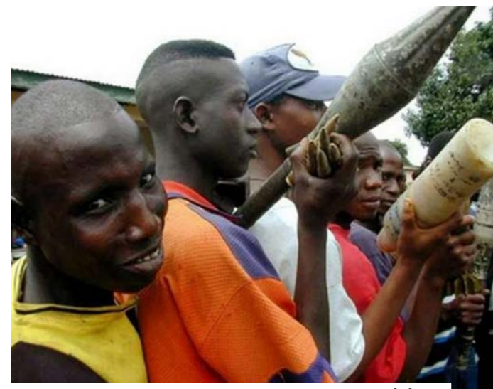
Au Sierra Leone, le gouvernement a interdit les armes légères pour mieux les réglementer.

La première phase a été massive. En janvier 2002, la fin officielle de la guerre a été précédée par le désarmement d'environ 45 000 combattants, dont 6 774 enfants soldats. Les opérations menées entre 1998 et 2002 ont aussi permis de col-