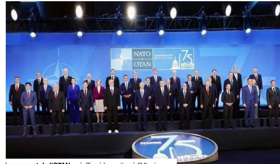
Le sommet de l'OTAN a réaffirmé le soutien à l'Ukraine.

Le texte préparé devait réaffirmer l'article 5, désigner la Russie comme menace durable pour la sécurité euro-atlantique, et rappeler que l'Iran ne doit pas accéder à l'arme nucléaire. Ce cadre diplomatique compte, mais il ne constitue pas le cœur du rendez-vous. L'enjeu d'Ankara était de transformer une solidarité stratégique proclamée en capacités financées et produites. Le mouvement a été accéléré par les États-Unis. Washington a lancé une revue de sa présence militaire en Europe, annoncé des retraits de troupes et réduit certains moyens prévus pour le modèle de forces de l'OTAN. La garantie américaine reste centrale, mais le message