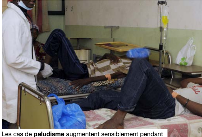
Les cas de paludisme augmentent sensiblement pendant l'hivernage.

Parmi les maladies fréquentes durant la saison des pluies, le paludisme reste la première préoccupation. Sa transmission augmente chaque année pendant cette période, avec un pic observé entre juillet et décembre. Le Mali fait partie des 11 pays les plus touchés par le paludisme, selon Medicines for Malaria Venture. En 2022, la maladie représentait 37% des consultations et 27% des décès dans les formations sanitaires. Le pays continue de porter une part importante de la charge mondiale. En 2023, il représentait 3,1% des cas de paludisme et 2,4% des décès dans le monde, ainsi qu'environ 6,6% des cas en Afrique de l'Ouest. Même si la prévalence chez les enfants de moins de cinq ans est passée de 47% en 2012 à 19% en 2021, les