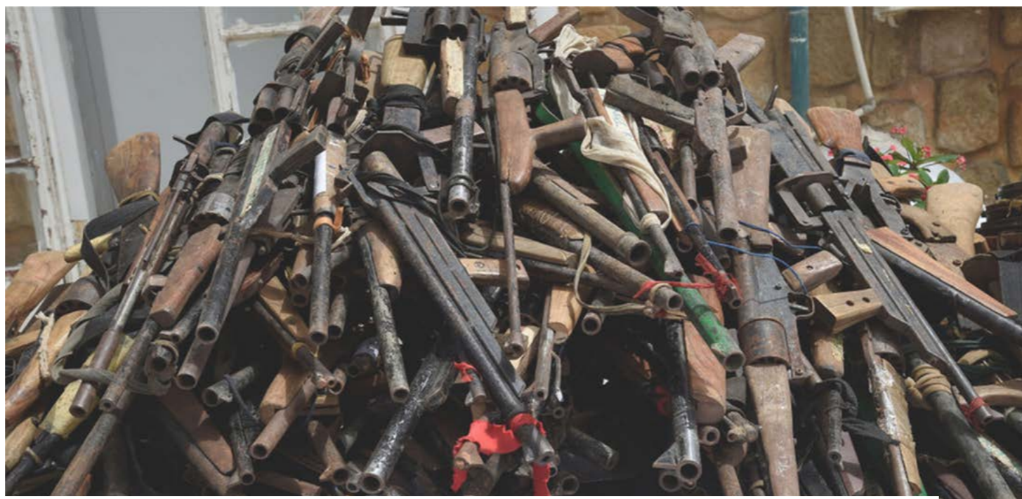
Des armes récupérées par le secretariat permanent de la Commission nationale de lutte contre la prolifération des armes légères en 2023.

tué un cadre régional de référence, mais le retrait du Mali, du Burkina Faso et du Niger, effectif depuis le 29 janvier 2025, impose une coopération sahélienne renouvelée. Les instruments internationaux insistent sur le marquage, l'enregistrement et le traçage pour limiter les détournements. L'un des instruments les plus visibles est le permis biométrique. Il vise à mieux savoir qui détient quelle arme, sous quelle autorisation et dans quelles conditions. Cette traçabilité peut aider à distinguer les détenteurs autorisés des circuits clandestins, à condition que les fichiers soient