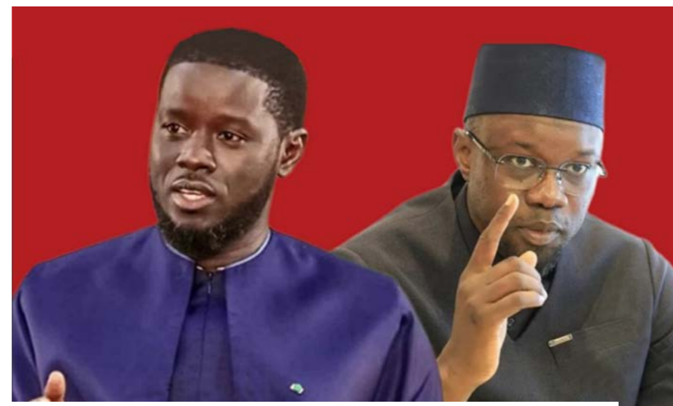
Les tensions continuent entre le Président sénégalais Diomaye Faye et le Président de l'Assemblée nationale, Ousmane Sonko.

Porté par six députés du groupe Pastef, le texte révisé la Constitution de 2001. Il reprend les corrections demandées par le Conseil constitutionnel dans sa décision du 13 mai, après validation de l'architecture générale de l'avant-projet. La réforme transforme le Conseil constitutionnel en Cour constitutionnelle. La nouvelle juridiction compte neuf membres au lieu de sept, avec trois membres nommés à partir d'une liste de cinq personnalités proposée par le Président de l'Assemblée nationale, après consultation du Bureau. Le texte renforce aussi le contrôle parlementaire. Il consolide les commissions d'enquête et impose une information ac-