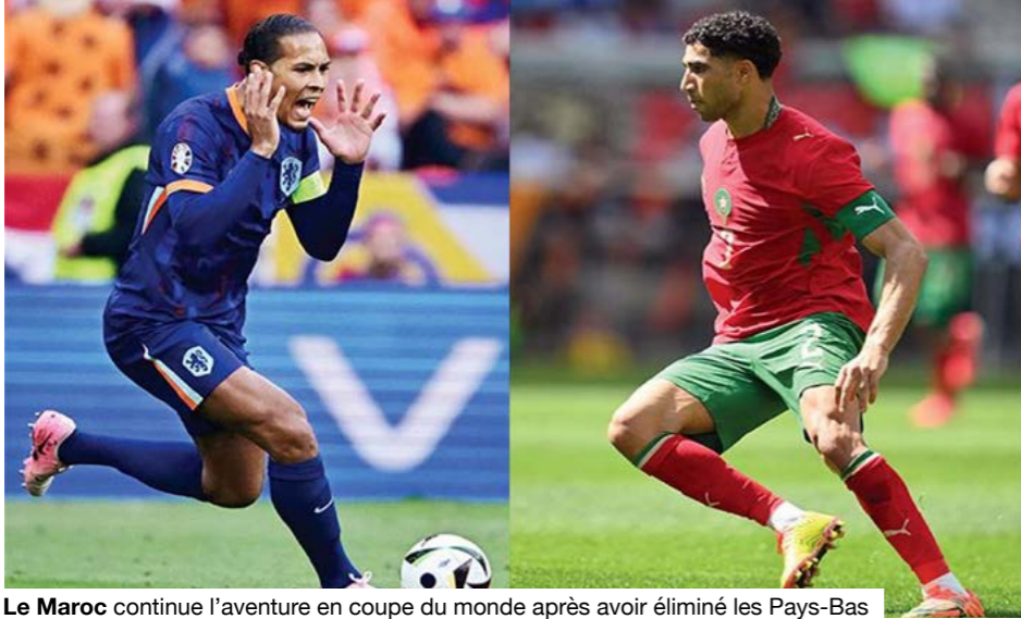
Le Maroc continue l'aventure en coupe du monde après avoir éliminé les Pays-Bas en 16 ème de finale.

Les premiers seizièmes de finale dessinent progressivement le visage de la présence africaine dans cette Coupe du monde 2026. Si les premiers verdicts ont déjà livré un premier enseignement, l'essentiel reste encore à écrire pour plusieurs représentants du continent. À ce stade de la compétition, l'Afrique peut toujours espérer renforcer sa présence au prochain tour grâce aux sélections qui n'ont pas encore disputé leur rencontre.