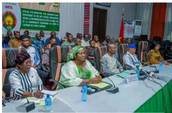
Ouverture de l'atelier des experts de l'AES sur la préparation des négociations avec la CEDEAO le 23 juin 2026 à Ouagadougou.

Les préparatifs des futures négociations entre la Confédération AES et la CEDEAO franchissent une nouvelle étape. Après les premières consultations engagées entre les deux organisations, l'AES s'est dotée le 26 juin 2026 d'un document-cadre stratégique destiné à servir de référence commune lors des discussions à venir. Élaboré à l'issue d'un atelier ayant réuni à Ouagadougou des experts du Mali, du Burkina Faso et du Niger, ce document vise notamment à harmoniser les positions des trois États, à identifier leurs intérêts stratégiques et à préparer un argumentaire commun. Il doit permettre à la Confédération d'aborder les futures discussions avec une position unifiée, tout en préservant les acquis jugés essentiels, notamment en matière de libre circulation, de développement, d'infrastructures et de sécurité. Cette démarche s'inscrit dans le prolongement des premières consultations officielles engagées entre l'AES et la CEDEAO. En mai 2025, les deux parties avaient convenu d'un cadre général devant régir leurs futurs échanges, avant que les chefs d'État de la Confédération n'en approuvent les conclusions quelques mois plus tard, en décembre 2025, à Bamako.