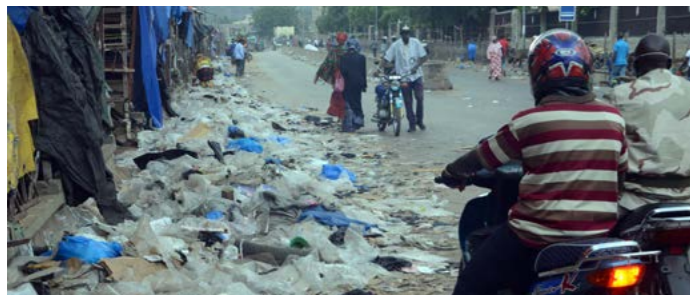
Des sachets plastiques entassés au bord d'une route à Bamako.

La loi n°2014-024 interdit la production, l'importation et la commercialisation des sachets plastiques non biodégradables. Elle a remplacé la loi de 2012, qui visait aussi la détention, l'utilisation et les granulés destinés à leur fabrication. Le décret n°2014-0595 fixe les modalités d'application et impose le marquage « biodégradable à 100% » sur les sachets autorisés. Le dispositif prévoit la saisie et la confiscation des produits interdits. Les sanctions distinguent deux cas. La production, l'importation ou la commercialisation exposent à 100 francs CFA par petit sachet et 200 francs CFA par grand sachet. L'obstacle aux agents verbalisateurs est puni de 20 000 à 120 000 francs CFA d'amende et, parfois, de 11 jours à trois mois de prison.