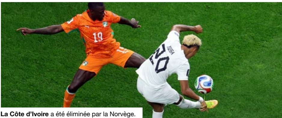
La Côte d'Ivoire a été éliminée par la Norvège.

Le premier tour à élimination directe a toutefois déjà été fatal à deux sélections africaines. L'Afrique du Sud a vu son aventure s'arrêter face au Canada, tandis que la Côte d'Ivoire a été battue par la Norvège, quittant la compétition avec des regrets. Ces deux éliminations réduisent les chances du continent de placer un grand nombre de représentants au tour suivant. Elles rappellent surtout que le moindre relâchement se paie au prix fort dans une phase à élimination directe où chaque détail peut faire basculer une rencontre. Les espoirs africains reposent désormais sur les sélections encore en lice, appelées à prendre le relais dans cette quête d'une présence renforcée au prochain tour. Deux autres représentants du continent étaient également en lice mercredi. La RDC n'a pas réussi à créer l'exploit face à l'Angleterre, s'inclinant 2-1. Le Sénégal a aussi perdu face à la Belgique dans l'autre affiche impliquant une sélection africaine.