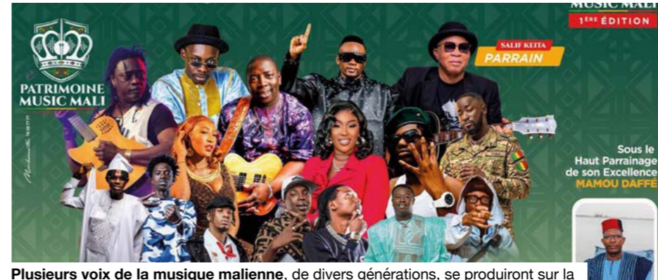
Plusieurs voix de la musique malienne, de divers générations, se produiront sur la même scène.

Le thème retenu, « Héritage sonore du Mali - Les Voix d'Hier et d'Aujourd'hui », inscrit l'événement dans une logique de transmission. L'affiche présente Salif Keïta comme Parrain et Oumou Sangaré comme Marraine. Autour d'eux, la programmation annoncée réunit Habib Koité, Cheick Tidiane Seck, Néba Solo, Baba Salah, Sidiki Diabaté, Vieux Farka Touré, Djénéba Seck, Tata Pound, King Massassy, Iba One, Kandia Kora,