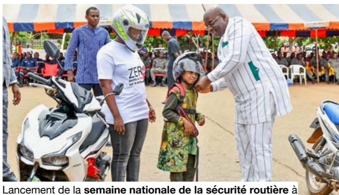
Lancement de la semaine nationale de la sécurité routière à Ouagadougou le 9 août 2024.

en 2018, de l'Observatoire africain de la sécurité routière. Cet observatoire vise à améliorer la qualité des statistiques, longtemps fragilisées par les écarts entre bilans officiels, données policières, données hospitalières et estimations internationales. Selon le SSATP, moins de la moitié des pays africains disposent de bases nationales opérationnelles sur les accidents et seuls 23 utilisent la définition internationale de la mortalité à 30 jours. Des réponses nationales se structurent aussi. Le Burkina Faso a validé une stratégie 2026 - 2030, avec l'objectif de réduire d'au moins 50% les décès routiers, après une moyenne annuelle de 23 107 accidents, 14 867 blessés et 1 091 morts entre 2020 et 2024. La sécurité routière devient donc un chantier africain commun. Elle exige des données fiables, des routes mieux conçues, des véhicules contrôlés, des conducteurs formés et des sanctions appliquées avec constance. ■