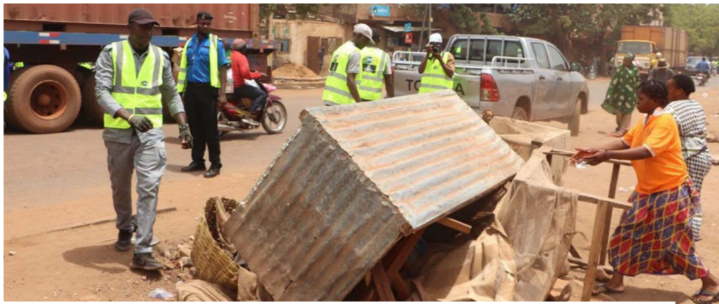
Les équipes mixtes ANASER-Police à pied d'oeuvre sur le terrain contre l'occupation anarchique des voies publiques le 29 juin 2026.

pour une prime à la conduite sans accident, afin de valoriser les chauffeurs les plus prudents, de limiter la fatigue au volant et de responsabiliser les compagnies sur la gestion de leurs équipages. Les deux et trois roues occupent une place centrale dans l'insécurité routière. Motocyclettes, tricycles et motos-taxis sont devenus indispensables à la mobilité urbaine, mais leur usage est faiblement encadré. Beaucoup circulent sans plaque, d'où l'opération spéciale d'immatriculation lancée le