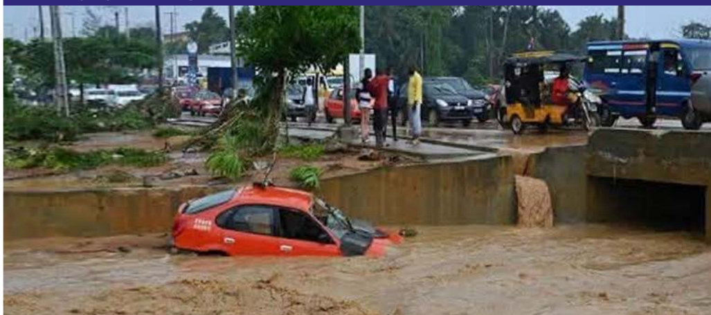
À Abidjan, des pluies diluviennes ont provoqué d'importantes inondations, et les autorités déplorent 59 morts, ce 1er juillet 2026.