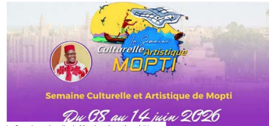
La Semaine culturelle de Mopti est à sa 4ème édition.

Le programme détaillé de l'édition 2026 prévoit plusieurs activités phares appréciées du grand public, comme des animations artistiques et culturelles. Les informations disponibles indiquent également que la manifestation s'inscrit dans la continuité des éditions précédentes, organisées par la Mairie de Mopti et ses partenaires. En 2024, la deuxième édition avait été annoncée du 19 au 23 juin autour du thème « La culture, facteur de paix, de sécurité et de développement ». Les acti-