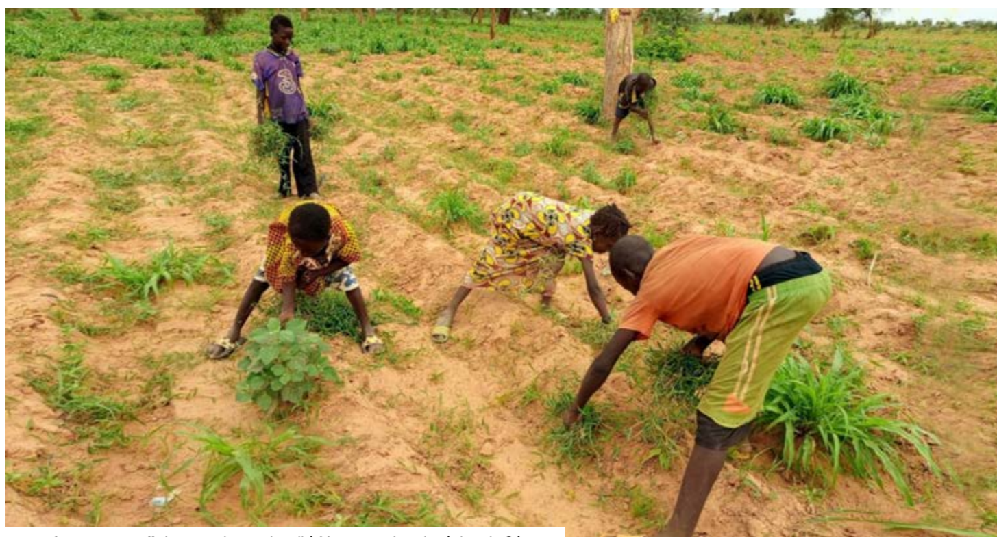
Des enfants au travail dans un champ de mil à Yangasso dans la région de Ségou.

Inégales vulnérabilités Les enfants au travail subissent tous les impacts négatifs du phénomène, mais l'âge, le