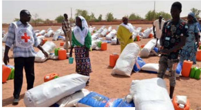
Distribution de vivres par le CICR à Sévaré.

Dans une note opérationnelle publiée le 9 juin 2026, le Comité international de la Croix-Rouge fait état de pertes en vies humaines, de blessés, de nouveaux déplacements et d'une fragilisation des services essentiels. Ces répercussions touchent des zones déjà éprouvées par l'insécurité, l'éloignement des structures de prise en charge et les difficultés d'accès aux biens de première nécessité. À Mopti, seize blessés ont été pris en charge après les violences enregistrées dans les cercles de Bandiagara et de Bankass, avec l'appui médical du CICR à l'hôpital régional. Des médicaments, du matériel médical et des équipements ont aussi été fournis aux structures sanitaires de Gao et de Mopti pour soutenir leur capacité de réponse.