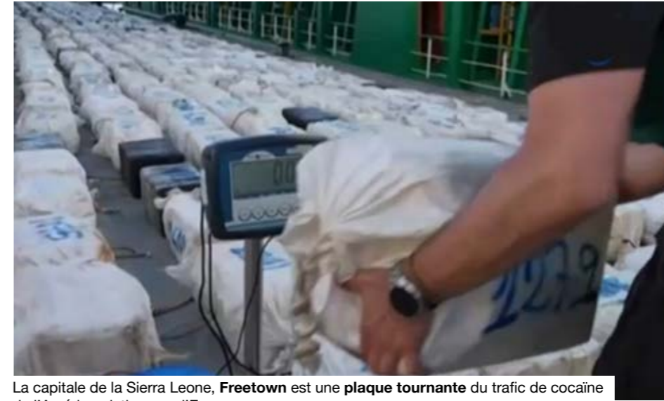
La capitale de la Sierra Leone, Freetown est une plaque tournante du trafic de cocaïne de l'Amérique latine vers l'Europe.

Le dossier part de l'interception de l'Arconian, le 1er mai 2026, au large du Sahara occidental. À bord de ce vraquier battant pavillon des Comores, les autorités espagnoles ont saisi 30,2 tonnes de cocaïne. Le navire avait quitté Freetown le 22 avril, après quatre jours passés au quai Elizabeth II. Selon le rapport, la cargaison aurait très probablement été chargée dans ce port avant son acheminement vers le nord de l'Atlantique. L'Arconian transportait 17 membres d'équipage philippins et 6 hommes armés, 5 Néerlandais et un Surinamais.