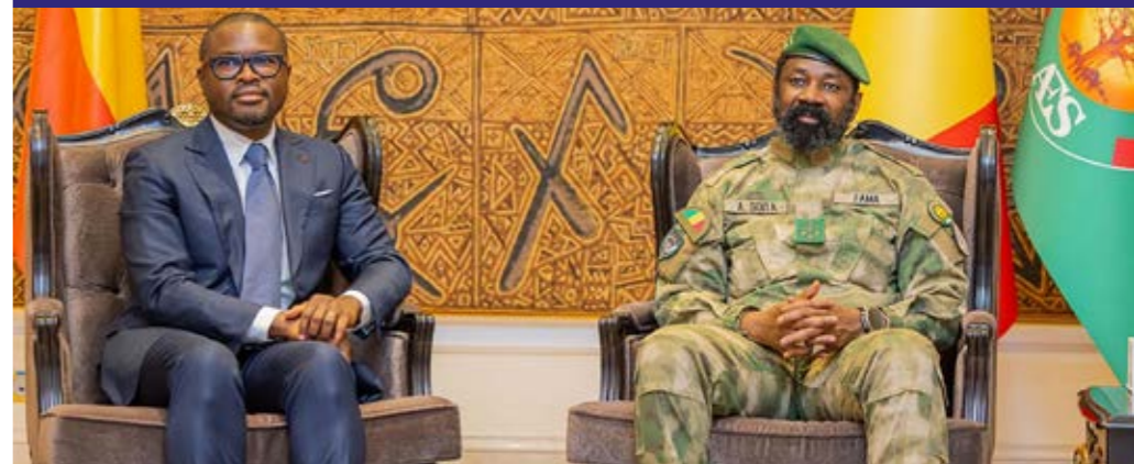
Le Président béninois, Romuald Wadagni , reçu par son homologue malien, Assimi Goïta , lors de sa visite de travail et d'amitié au Mali, le 9 juin 2026.