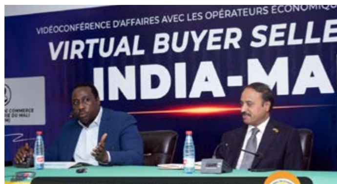
Le forum Mali-Inde marque un tournant dans les échanges économiques entre les deux pays.

Le forum se tiendra à Bamako et réunira des acteurs économiques autour des échanges, des investissements et des possibilités de coopération. Les exportations maliennes vers l'Inde ont atteint 82,5 millions de dollars en 2024, grâce à un accès au marché indien à travers un régime de droit préférentiel, a révélé le responsable de la Confédération de l'Industrie Indienne (CII) lors du forum d'affaires Inde - Mali, en octobre 2025. À l'issue de cette rencontre, un protocole d'accord créant le Conseil des affaires Inde - Mali a été signé afin de promouvoir les relations économiques, commerciales et d'investissement. Représentant environ 69% du PIB, le commerce occupe une place centrale dans l'économie malienne. Le pays exporte essentiellement des matières premières, principalement l'or, qui représente jusqu'à 70% des exportations, suivi du coton, des animaux vivants et des produits agricoles. Les principales filières d'exportation sont le coton, le karité, les mangues, l'anacarde et le sésame, mais aussi les produits transformés et artisanaux. Les importations