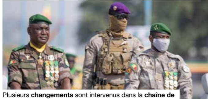
Plusieurs changements sont intervenus dans la chaîne de commandement de l'armée.

Menaces Depuis cette date, le dispositif malien fait face à des menaces plus complexes. La jonction opérationnelle entre la mouvance jihadiste affiliée à Al-Qaïda et certains groupes armés du Nord donne aux attaques une autre portée. Elle combine pression militaire, guerre d'axes, frappes contre des positions symboliques,