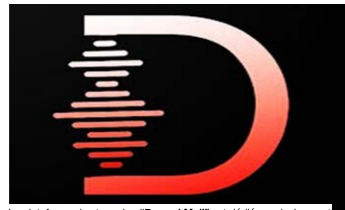
La plateforme de streaming "Doremi Mali" est dédiée exclusivement à la musique malienne.

musiciens, les producteurs et les labels qui peinent parfois à trouver leur place sur les plateformes mondiales. En plus de la simple écoute musicale, la plateforme continue d'évoluer. Les récentes mises à jour ont notamment introduit la vente de billets de concerts, une fonctionnalité qui témoigne de la volonté de ses concepteurs de bâtir un véritable écosystème autour de la musique et des événements culturels. Cette évolution intervient dans un contexte où la consommation numérique des contenus culturels connaît une croissance constante sur le continent africain. Pour les artistes maliens, l'enjeu ne se limite