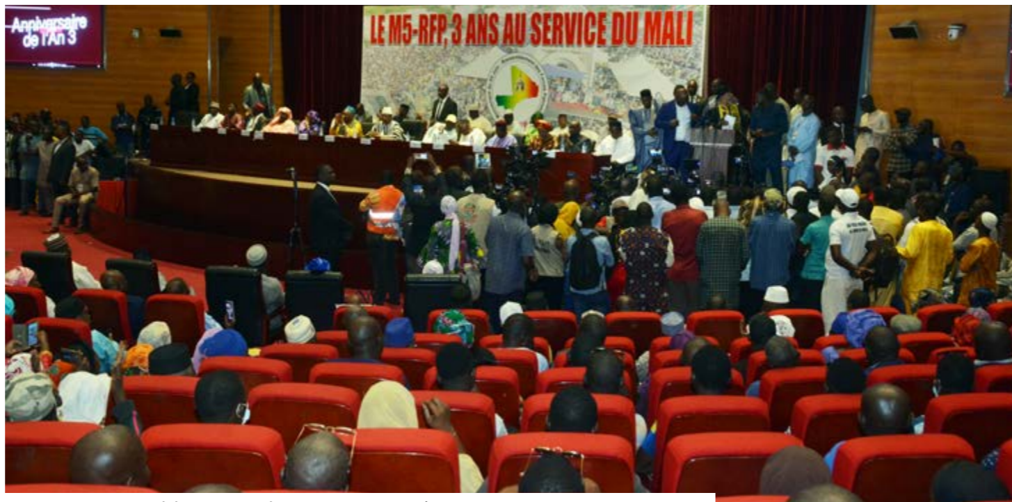
Le M5-RFP lors de la cérémonie commémorative au CICB du 3 ème anniversaire du mouvement en 2023.