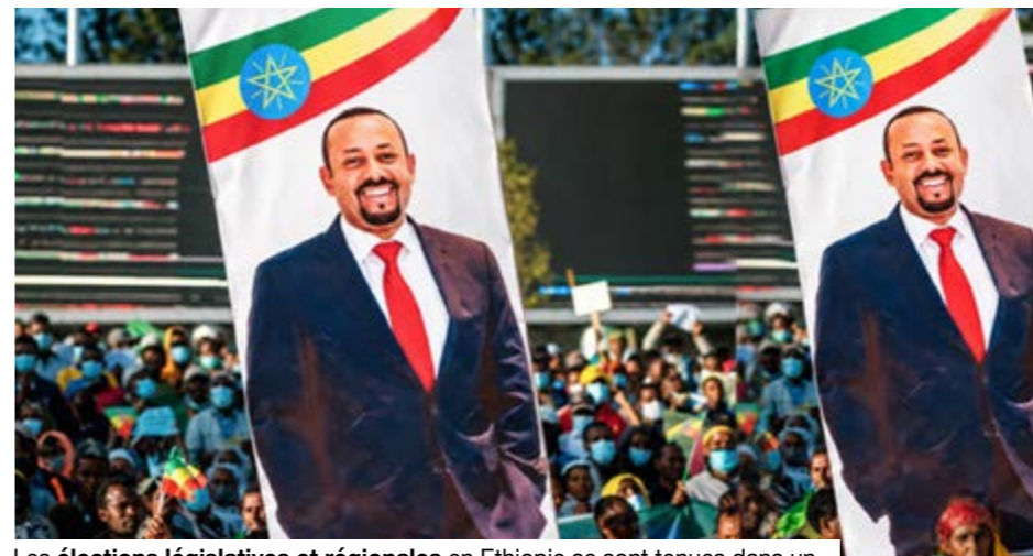
Les élections législatives et régionales en Éthiopie se sont tenues dans un climat de tensions.

Le vote doit renouveler la Chambre des représentants du peuple, dont les membres désignent ensuite le chef du gouvernement. Le Parti de la prospérité du Premier ministre Abiy Ahmed, largement majoritaire depuis les élections de 2021, part favori face à une opposition divisée, affaiblie par les restrictions politiques, les arrestations dénoncées par plusieurs formations et les difficultés de campagne dans les régions instables. L'absence du Tigré constitue le principal point de tension. Cette région du nord, frontalière de l'Érythrée et proche du Soudan, est administrée par une structure