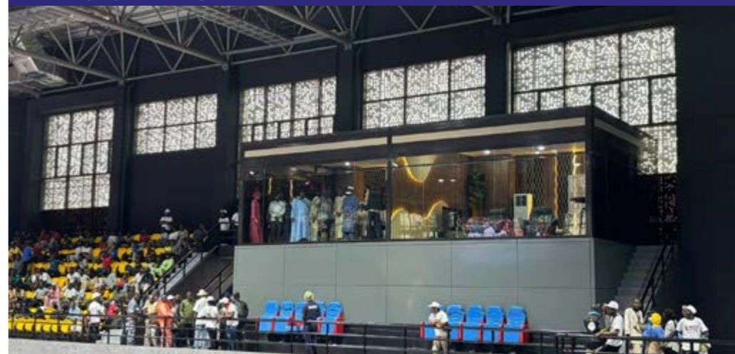
Le Palais des Sports Salamatou Maïga, entièrement rénové, a été rouvert le 30 mai 2026 sous la présidence du Premier ministre, en présence de plusieurs membres du gouvernement.