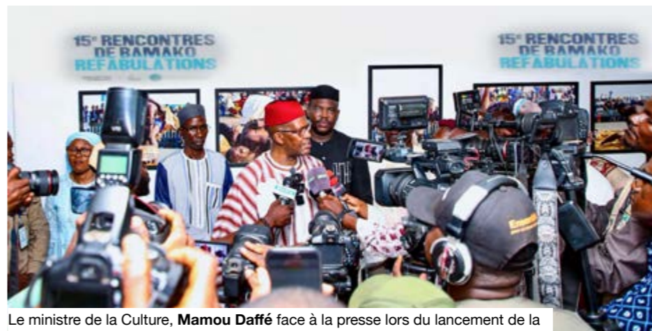
Le ministre de la Culture, Mamou Daffé face à la presse lors du lancement de la 15ème édition des Rencontres de Bamako.

À Bamako, la photographie se prépare à reprendre sa fonction première : regarder, témoigner, questionner. Prévue du 26 novembre 2026 au 26 janvier 2027, la 15ème édition des Rencontres de Bamako, Biennale africaine de la photographie, attend les propositions de photographes, vidéastes, performeurs et artistes visuels d'Afrique, de la diaspora et des communautés afro-descendantes. L'appel, ouvert jusqu'au 20 juin, dépasse