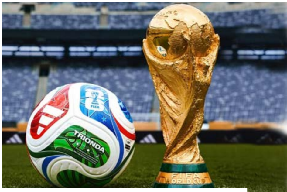
Les représentants africains affûtent leurs armes pour la Coupe du monde 2026.

Le Maroc, notamment, impressionne par sa solidité. Les Lions de l'Atlas ont successivement dominé le Burundi (5-0) et Madagascar (4-0) et tenteront de confirmer contre la Norvège le 7 juin, avant de retrouver le Brésil dans le groupe C. Dans la même dynamique, le Cap-Vert a marqué les esprits en dominant la Serbie (3-0). Les Requins Bleus affron-