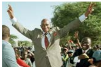
Au Sénégal, la Coalition qui a porté Abdoulaye Wade au pouvoir s'est par la suite fracturée.

Dans l'histoire politique africaine, les coalitions naissent fréquemment dans l'adversité. Face à un régime contesté, à un parti dominant ou à un pouvoir jugé défaillant, des acteurs aux sensibilités parfois opposées décident de mettre de côté leurs divergences pour poursuivre un objectif commun. Mais, une fois cet objectif atteint, l'unité affichée laisse fréquemment place aux rivalités et aux désaccords. Le phénomène est loin d'être exceptionnel. En Afrique du Sud, l'Alliance tripartite, réunissant l'ANC, le Parti communiste sud-africain et la centrale syndicale COSATU, a constitué l'un des principaux moteurs de la lutte contre l'apartheid. Pourtant, une fois au pouvoir,