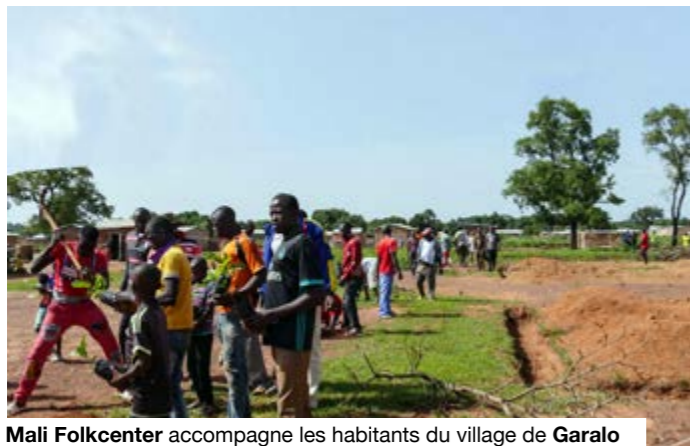
Mali Folkcenter accompagne les habitants du village de Garalo (Bougouni) dans la plantation d'arbres.

Inspiré par la nature. Pour le climat. Pour notre avenir », tel est le thème de la Journée mondiale de l'environnement 2026, avec pour mot d'ordre « Maintenant pour le climat ». Il souligne l'urgence des actions à entreprendre et le rôle central de la nature dans les réponses aux dérèglements climatiques. Pour le Mali, ce thème renvoie à la nécessité de solutions concrètes pour renforcer la résilience des communautés. Il concerne directement la gestion de l'eau, la protection des terres, l'adaptation agricole, la sauvegarde des pâturages et la prévention des tensions autour des ressources naturelles.