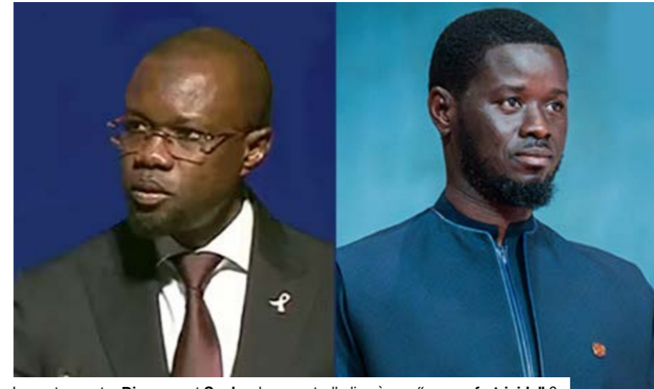
La rupture entre Diomaye et Sonko donnera-t-elle lieu à une "guerre fratricide" ?

Depuis leur arrivée au pouvoir en 2024, les deux hommes incarnent une architecture politique rare. Diomaye détenait la légitimité présidentielle issue des urnes, Sonko conservait la légitimité militante, populaire et partisane qui avait porté le Pastef. Cette répartition pouvait tenir tant que le duo parlait d'une même voix. Elle devenait difficile dès lors que les arbitrages sur la dette, les discussions avec le FMI, les subventions, le coût de la vie et le rythme des réformes faisaient apparaître deux centres de décision. La rupture ne concerne donc pas seu-