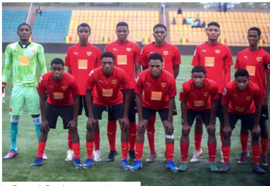
Les Rouges de Bamako en route vers le sacre.

Le sprint final du championnat débute ce dimanche 31 mai avec la 23ème journée, dans un contexte où le Djoliba AC semble plus que jamais maître de son destin. Leaders avec 50 points après 22 journées, les Rouges disposent de 8