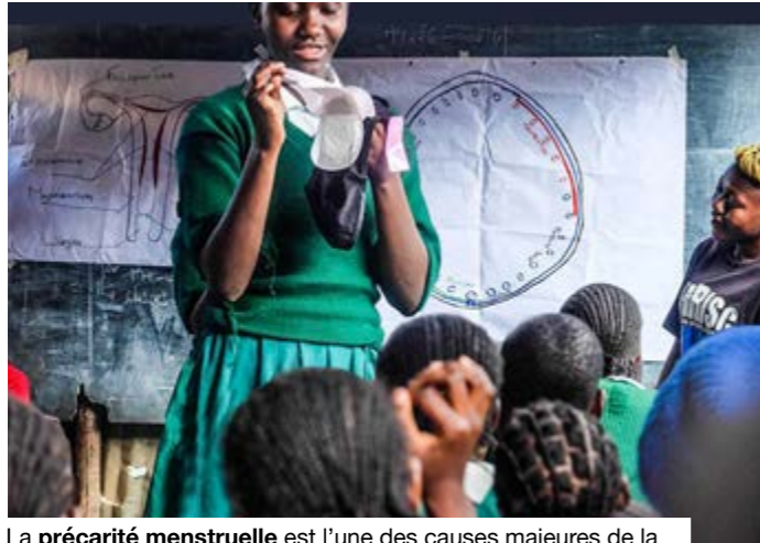
La précarité menstruelle est l'une des causes majeures de la déscolarisation de nombreuses filles.

La précarité menstruelle est « un phénomène bien trop courant » au Mali, selon Plan International. Des difficultés d'accès aux produits hygiéniques à l'absence d'installations adaptées, notamment l'eau, l'assainissement et les espaces sûrs, la gestion des règles est problématique pour de nombreuses filles. À cela s'ajoute la difficulté de jeter correctement les protections usagées, ce qui pousse certaines élèves à rester à la maison pendant leurs menstruations. À travers le monde, des centaines de millions de femmes et de filles peinent encore à disposer de protections menstruelles, de sous-vêtements propres, d'antidouleurs ou de toilettes sûres pendant leurs règles. Parmi les freins à l'édu-