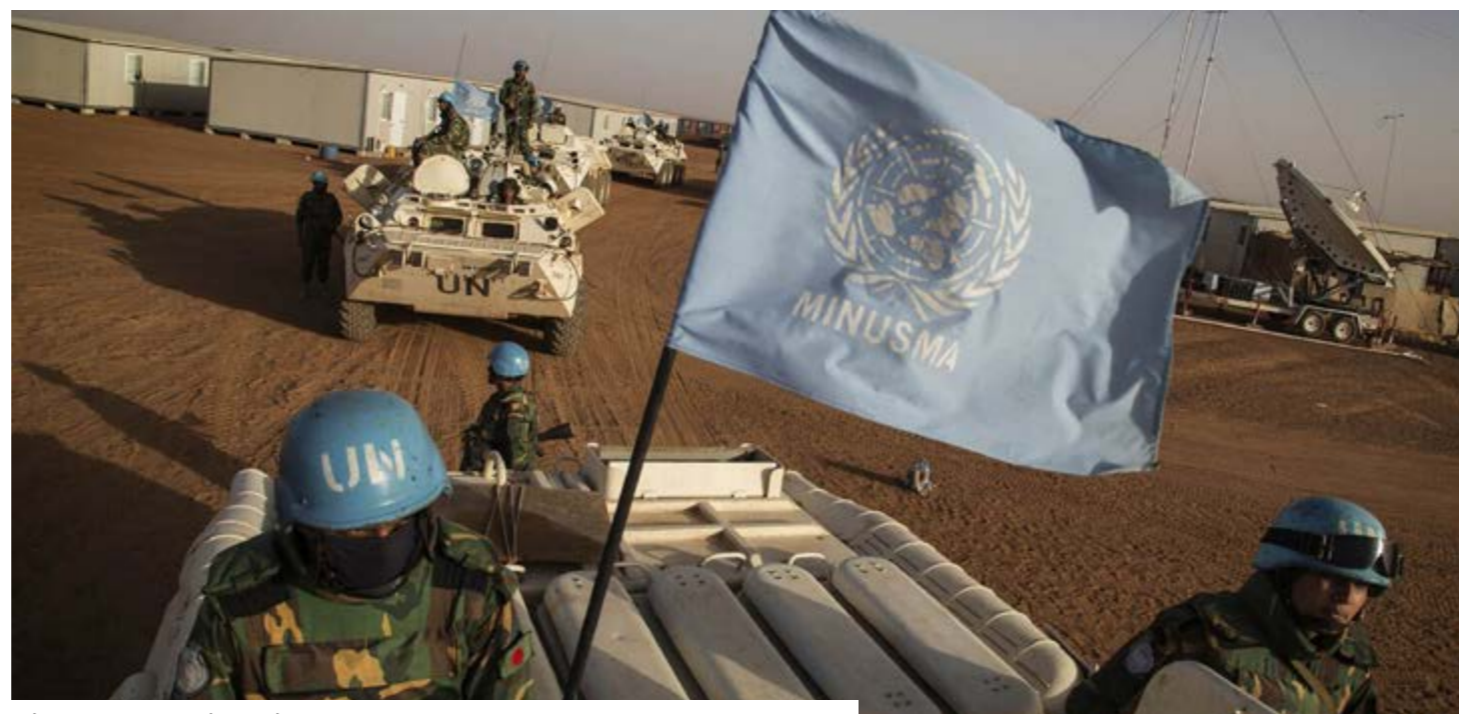
Près de trois ans après le départ des casques bleus du Mali, les violences persistent.