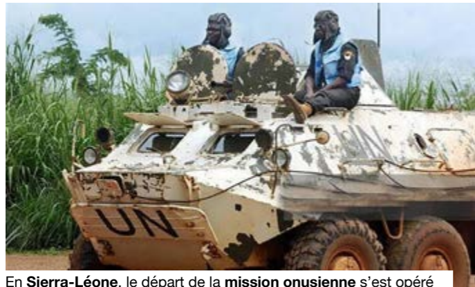
En Sierra-Léone, le départ de la mission onusienne s'est opéré en douceur.

Déployée en 1999, l'UNAMSIL, la Mission des Nations unies en Sierra Leone, avait été chargée d'accompagner la sortie d'une guerre civile marquée par les massacres, les déplacements forcés, les amputations et l'effondrement de l'autorité publique. Elle a appuyé le désarmement des combattants, le retour progressif de l'État, l'organisation d'élections et la restauration d'un minimum de confiance entre les institutions et les populations. Son départ, en décembre 2005, n'a pas pris la forme d'une rupture brutale. La mission a été relayée par l'UNIOSIL, le Bureau intégré des Nations unies en Sierra Leone,