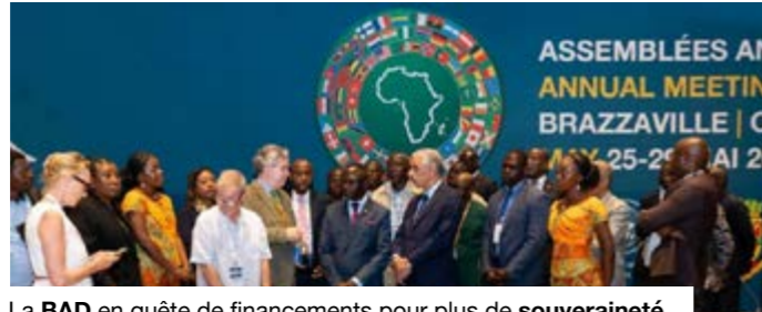
La BAD en quête de financements pour plus de souveraineté.

transformer les ressources africaines en capacités de financement rapides, accessibles et moins coûteuses. Le continent dispose d'atouts considérables. Le fleuve Congo, long d'environ 4 700 kilomètres, porte un potentiel hydroélectrique estimé à 150 000 MW, soit près de 37% du potentiel africain. À cela s'ajoutent les minerais stratégiques liés à la transition énergétique, près de 60% des meilleures ressources solaires mondiales et le marché unique de 1,4 milliard de personnes ouvert par la Zlecaf. Mais ces atouts ne produiront leurs effets que si les infrastructures, l'énergie, la transformation locale et l'intégration commerciale progressent. Les assemblées de Tinkélé devront préciser comment passer du potentiel au financement, puis aux projets capables de soutenir l'industrialisation, l'emploi et la souveraineté économique africaine. ■