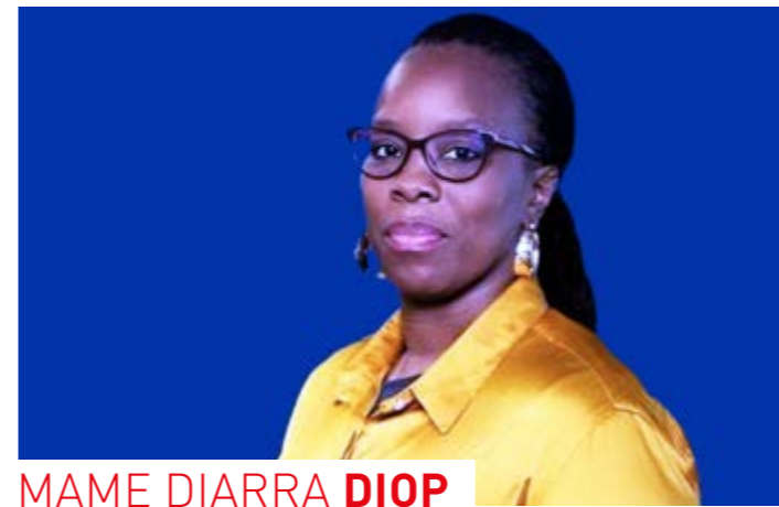
MAME DIARRA DIOP

En Afrique de l'Ouest, les États tentent par ailleurs de préserver les acquis de l'intégration régionale, malgré la fragmentation récente de la CEDEAO, consécutive au retrait du Burkina Faso, du Mali et du Niger, effectif depuis le 29 janvier 2025. Selon plusieurs observateurs, l'intégration du continent ne pourra cependant pas devenir pleinement effective sans une amélioration concrète des conditions de circulation entre les pays africains. « L'intégration avance, mais elle est encore incomplète dans sa mise en œuvre concrète », estime M. Sidibé. Selon lui, le défi pour les États africains sera désormais de parvenir à concilier les impératifs de sécurité avec une circulation plus fluide des personnes et des biens. ■