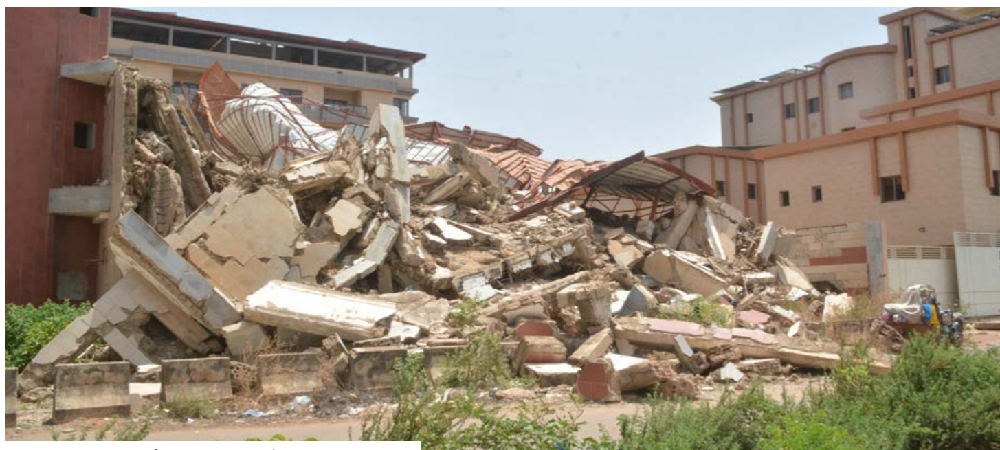
Un immeuble effondré dans l'ACI 2000 à Bamako en 2025.

dossier doit être élaboré par un architecte agréé, sauf dans certains cas attribués à un ingénieur-conseil agréé. Le permis doit être refusé si le projet ne respecte pas les règles d'urbanisme ou les normes. Une construction nouvelle ou réaménagée ne peut pas être occupée avant un constat de conformité. Le cadre officiel impose aussi l'identification du chantier par un panneau mentionnant le maître d'ouvrage, le maître d'œuvre, l'entreprise, la nature