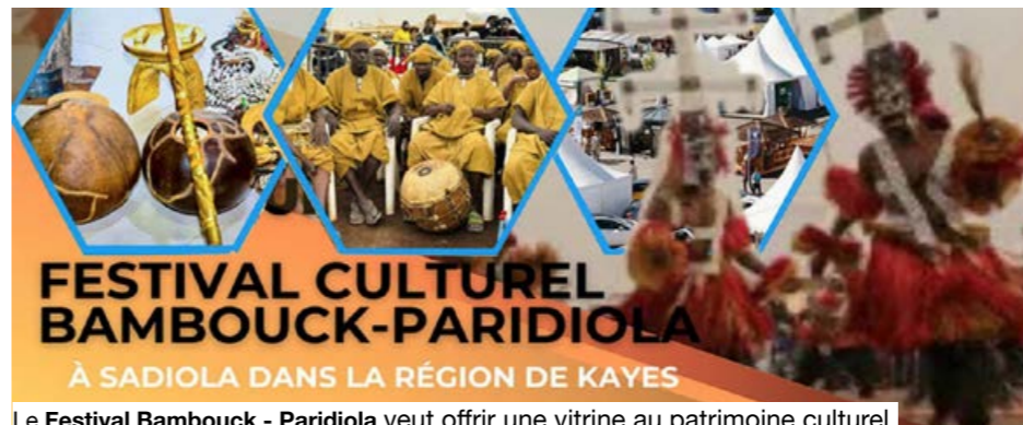
Le Festival Bambouck - Paridiola veut offrir une vitrine au patrimoine culturel du Bambouck.

Dans cette partie de la région de Kayes associée à l'histoire du Bambouck, ancien pays de l'or situé entre la Falémé et le Bafing, la culture demeure un langage de transmission. La 6ème édition du festival, placée sur le thème « Le Bambouck culturel : vecteur de paix et de réconciliation nationale », entend faire vivre cette mémoire tout en rassemblant les communautés autour de leurs valeurs communes. Organisé par l'Association Paridiola, le rendez-vous veut offrir une vitrine au patrimoine culturel, artistique et historique