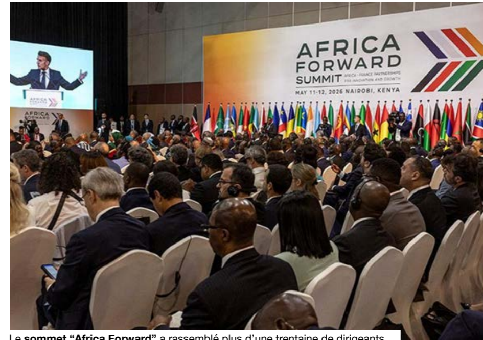
Le sommet "Africa Forward" a rassemblé plus d'une trentaine de dirigeants africains à Nairobi.

Le sommet Africa Forward s'est tenu les 11 et 12 mai 2026 à Nairobi, sur le thème « Partenariats Afrique-France pour l'innovation et la croissance ». Coprésidé par William Ruto et Emmanuel Macron, il a rassemblé plus de trente dirigeants africains, des institutions financières, des entreprises et des acteurs de l'innovation. Le choix du Kenya marque une inflexion. Pour la première fois, ce format est organisé dans un pays africain anglophone, loin du cadre francophone qui a longtemps structuré les relations politiques de Paris avec le continent.