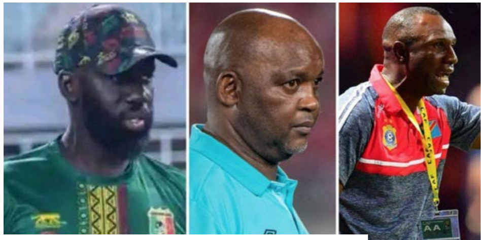
28 entraîneurs sont en course pour prendre les commandes des Aigles.

La succession de Tom Saintfiét à la tête des Aigles du Mali suscite un vif intérêt. Selon les informations de la FEMAFoot, 28 dossiers de candidatures ont été déposés pour prendre les commandes de la sélection nationale malienne. Parmi les candidatures figure celle du technicien malien Baye Bah, Champion d'Afrique U17 et Vice-champion du monde U17 avec le Mali en 2015. Son compatriote Fousseyni Diawara, actuel sélectionneur des Aigles Espoirs, apparaît également comme un sérieux