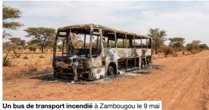
Un bus de transport incendié à Zambougou le 9 mai pour non respect du blocus.

Sur le terrain, la menace est bien réelle. Les groupes armés terroristes multiplient les actions de sabotage, les embuscades et les intimidations contre les transporteurs civils afin de perturber l'approvisionnement de la capitale et d'installer un climat de peur. Toutefois, malgré les difficultés, les principaux corridors routiers ne sont pas totalement coupés et l'armée malienne poursuit ses opérations pour contenir la pression jihadiste. Le week-end dernier, une nouvelle étape a été franchie avec l'incendie d'une douzaine de cars à Zambougou, à une trentaine de kilomètres de Ségou, sur l'axe reliant le centre du pays à Bamako.