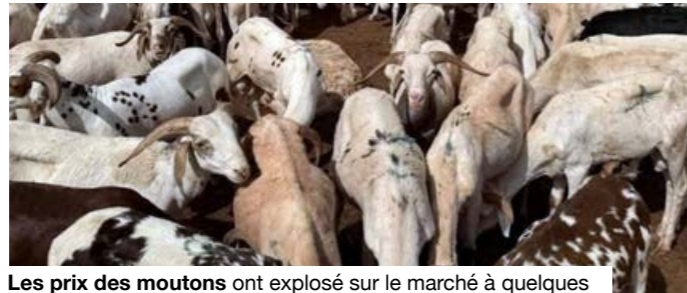
Les prix des moutons ont explosé sur le marché à quelques jours de la Tabaski.

Des prix hors de contrôle Dans ce contexte, chaque vendeur répercute sur le prix des