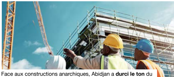
Face aux constructions anarchiques, Abidjan a durci le ton du contrôle des chantiers.

La Côte d'Ivoire n'offre pas un modèle parfait. Des immeubles s'y sont encore effondrés ces dernières années. Mais son expérience donne un point de comparaison utile aux pays de la sous-région confrontés aux mêmes risques. Face aux constructions anarchiques, Abidjan a durci le ton. Le contrôle des chantiers n'est plus présenté seulement comme une étape administrative liée au permis