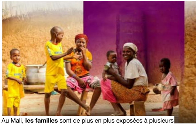
Au Mali, les familles sont de plus en plus exposées à plusieurs risques.

Rôle des pouvoirs publics et des communautés dans la protection de la famille et des enfants face aux effets du changement climatique et aux risques liés aux stupéfiants », c'est le thème national de l'édition 2026 de cette journée. Un thème qui parle des réalités des familles maliennes, confrontées à des pressions économiques, sociales et environnementales de plus en plus fortes. Il rappelle aussi, selon le ministère en charge de la protection de la famille, les défis liés aux effets néfastes des changements climatiques et à la consommation de stupéfiants par les enfants. Le changement climatique affecte tous les aspects de la vie quotidienne. Le Mali, marqué par la variabilité de son climat, la fragilité de ses écosystèmes et la vulnérabilité de ses systèmes de production, reste particulièrement exposé