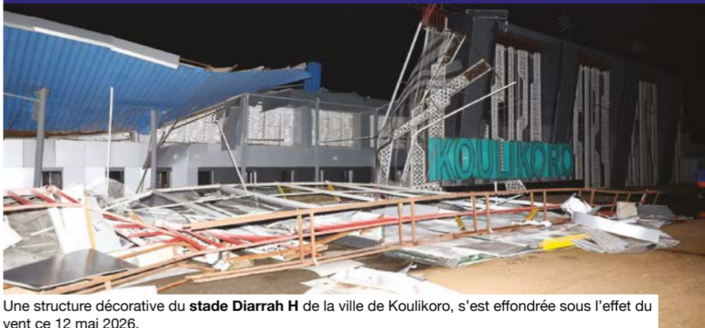
Une structure décorative du stade Diarra H de la ville de Koulikoro, s'est effondrée sous l'effet du vent ce 12 mai 2026.