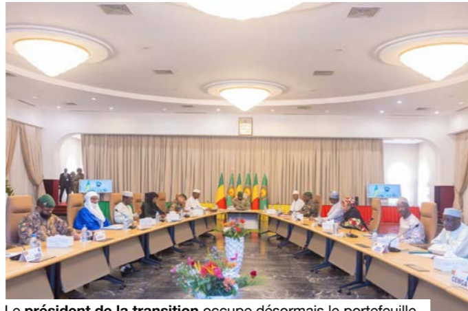
Le président de la transition occupe désormais le portefeuille de la défense dans la nouvelle architecture.

L'adoption de seize orientations stratégiques à l'issue du Conseil supérieur de la Défense nationale du 29 avril 2026 marque un tournant dans la réponse sécuritaire de l'État malien face à la menace terroriste. Sans surprise, ces directives s'articulent autour de piliers classiques en contexte de lutte asymétrique : densification du maillage territorial, intensification des opérations offensives, amélioration du renseignement et renforcement de la coordination entre forces, avec en toile de fond une volonté accrue d'impliquer les populations. L'objectif est de réduire les marges de manœuvre des groupes armés terroristes en multipliant les points de contrôle, en accélérant les frappes ciblées et en fluidifiant la chaîne décisionnelle. Ce choix répond à une urgence opérationnelle évidente après des attaques coordonnées ayant mis en lumière des failles dans l'anticipation et la prévention.