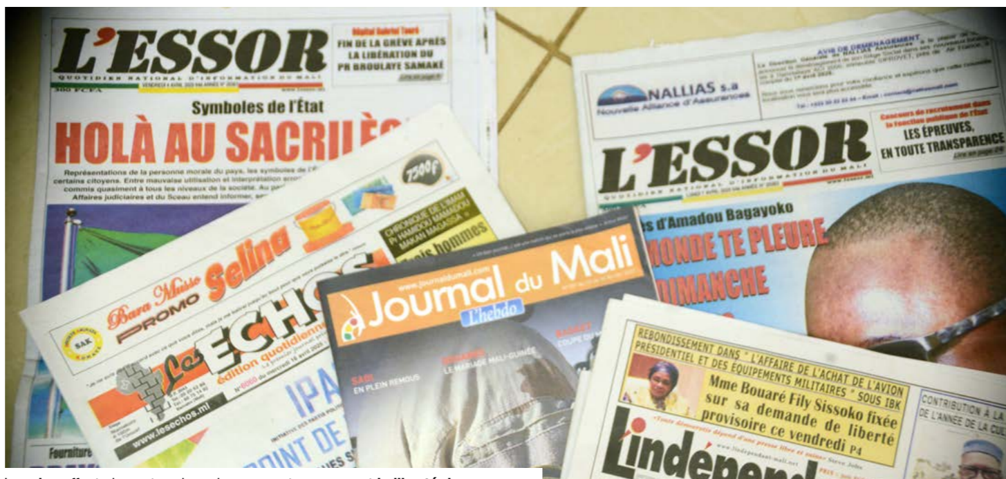
La crise affecte les entreprises de presse et compromet la liberté de presse.

2003, complété par l'arrêt n°04-1549 MCNT, n'est plus effective depuis 2019. La loi n°2012-019 du 12 mars 2012 relative aux services privés de communication audiovisuelle introduit le principe d'autorisation préalable et classe les organes en radios commerciales et non commerciales. Mais les charges fiscales sont jugées lourdes et certaines sanctions pénales prévues par ce cadre sont considérées comme restrictives. D'autres textes influencent l'environnement médiatique. La loi n°98-012 sur les relations entre l'administration et les usagers, la loi n°2013-015 sur les données personnelles