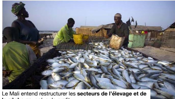
Le Mali entend restructurer les secteurs de l'élevage et de la pêche pour plus de profit.

Announced en Conseil des ministres, la rencontre s'inscrit dans une démarche de diagnostic et d'écoute des acteurs. Elle porte sur des filières présentées officiellement comme un moteur essentiel pour la sécurité alimentaire et nutritionnelle, mais aussi pour les revenus ruraux, les recettes locales et l'emploi. Le poids économique est considérable. Selon les données sectorielles disponibles, l'élevage, la pêche et l'aquaculture sont pratiqués par plus de 85% de la population, procurent des revenus à environ 30% des Maliens et contribuent à près de 19% du PIB. Le pays dispose d'un cheptel estimé à plus de 15 millions de bovins, 32 millions de petits ruminants et 37 millions de volailles. Ce potentiel contraste avec les limites observées sur le terrain. Les producteurs vendent encore souvent des animaux, du lait ou du poisson avec peu de transformation locale. Les pertes restent liées au manque de froid, de stockage, de transport, d'abattoirs modernes, d'unités laitières et d'équipements adaptés. Les femmes engagées dans le