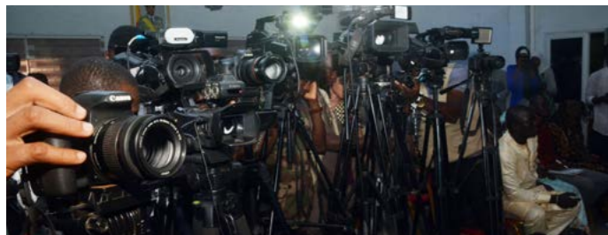
Les politiques de sécurité remettent en cause la liberté de presse dans plusieurs pays.

En 2026, Reporters sans frontières (RSF) dresse un bilan encore alarmant de la liberté de la presse à travers le monde. Plus de la moitié des 180 pays classés connaissent une situation « difficile » ou « très grave » de la liberté de la presse. Dans un contexte de politique sécuritaire, des lois plus restrictives remettent en cause