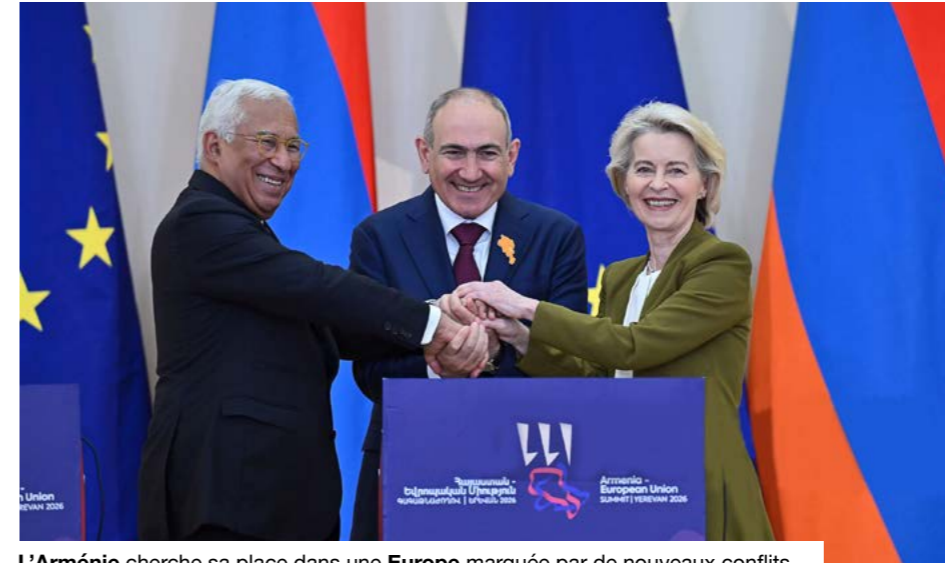
L'Arménie cherche sa place dans une Europe marquée par de nouveaux conflits.

Créée en 2022, la Communauté politique européenne réunit les États membres de l'Union européenne et des pays non membres autour de sujets communs, sans pouvoir décisionnel contraignant. Pour cette huitième édition, 48 chefs d'État et de gouvernement ont été invités, avec la participation de dirigeants venus de près de 50 pays et organisations partenaires. Les échanges ont porté sur la résilience démocratique, la connectivité, la sécurité économique et énergétique, ainsi que sur les crises régionales. La guerre en Ukraine a occupé une place