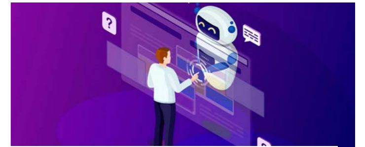
Le Chatbot universitaire de Dev Web Sensei facilite les démarches pédagogiques des étudiants.

relevés de notes, informations sur les calendriers universitaires, ou encore procédures de bourses : autant de démarches souvent longues, confuses et centralisées, qui obligent les étudiants à multiplier les déplacements et à affronter des files d'attente interminables. Grâce à une interface conversationnelle accessible via smartphone ou ordinateur, ce chatbot permettrait d'obtenir des réponses instantanées 24h/24. Il jouerait ainsi le rôle d'un assistant virtuel capable d'orienter l'étudiant, de lui fournir des informations fiables et, à terme, d'automatiser certaines procédures administratives. Une telle innovation