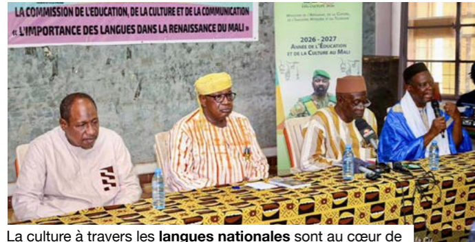
La culture à travers les langues nationales sont au cœur de la stratégie de refondation.

Les travaux porteront sur le thème « Médias et langues nationales : quels enjeux pour les sociétés africaines contemporaines ». Annoncée en Conseil des ministres, la rencontre vise à renforcer les échanges scientifiques entre universitaires, chercheurs, experts maliens et étrangers autour de l'information, de la communication et de l'usage des langues nationales comme médium de développement. Au Mali, le sujet renvoie à une réalité institutionnelle et sociale. La Constitution de 2023 a reconnu les langues nationales comme langues officielles, tandis que le français demeure langue de travail. En ville comme en zone rurale, les échanges quotidiens et les débats communautaires se font largement en bambara, peul, songhaï, arabe, tamasheq, soninké, dogon ou sénoufo, etc. Dans ce paysage, les radios communautaires restent des