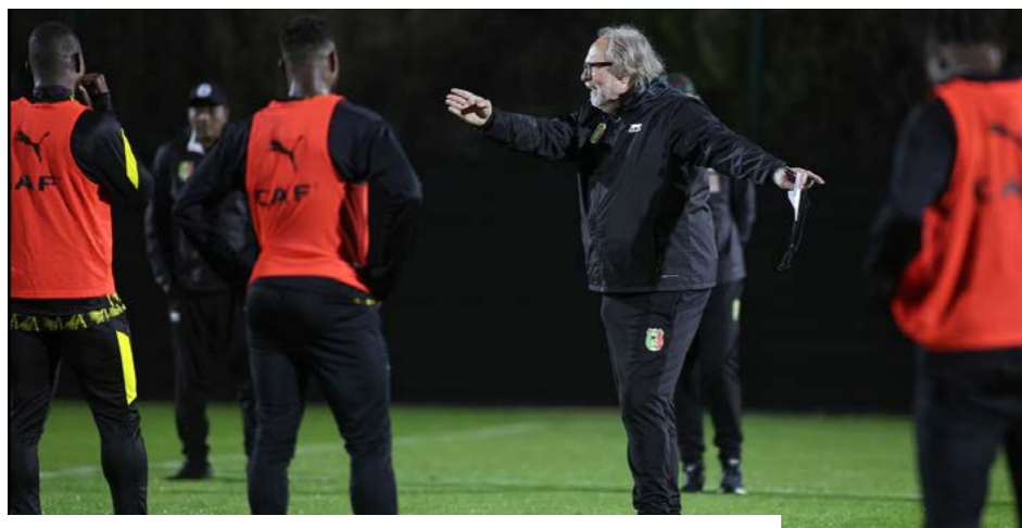
Le technicien belge lors d'une séance d'entraînement avec les Aigles.

Suspendu à titre conservatoire depuis décembre 2024 suite à un contrôle positif au melonidium, le joueur de Chelsea, l'Ukrainien Mykhailo Mudryk , a été condamné le 29 avril 2026 à une suspension de quatre ans des terrains par la Fédération anglaise, soit jusqu'en décembre 2028. Il s'agit de la sanction maximale.