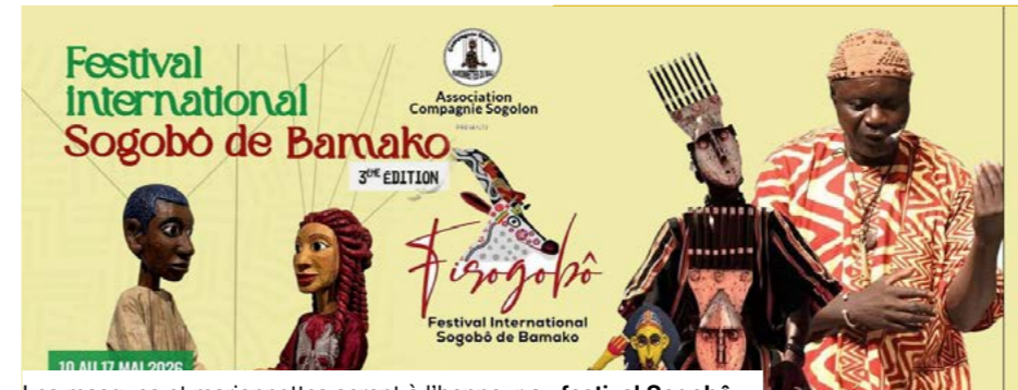
Les masques et marionnettes seront à l'honneur au festival Sogobô.

Porté par la Compagnie Sogolon, le Festival Sogobô s'inscrit dans une initiative récente visant à structurer et à rendre visibles des pratiques ancrées dans les traditions. Consacré aux masques et aux marionnettes, il rassemble artistes, artisans et chercheurs autour d'un patrimoine transmis de génération en génération dans plusieurs régions du pays, notamment dans les espaces culturels liés au Sogo bô. Les pratiques liées aux marionnettes du Mali figurent parmi les formes d'expression artistique les plus anciennes d'Afrique de l'Ouest, associées à