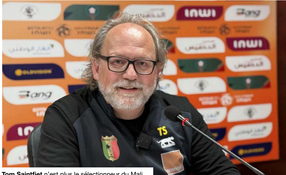
Tom Saintfiet n'est plus le sélectionneur du Mali.