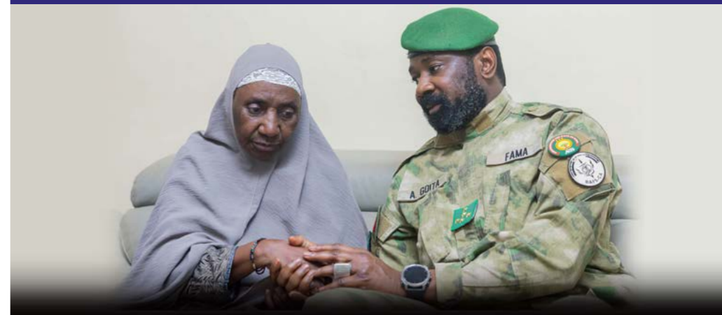
Le Président de la Transition, le 28 avril 2026, aux côtés de la mère de Sadio Camara, ministre de la Défense tué lors de l'attaque de sa résidence à Kati, le 25 avril 2026.