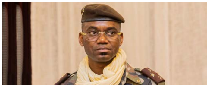
Le Général Sadio Camara est tombé les armes à la main.

La disparition tragique et brutale du Général Sadio Camara intervient dans un contexte de crise sécuritaire aiguë, au moment même où il incarnait la ligne de fermeté du pouvoir face aux groupes armés. Né le 22 mars 1979 à Kati, le Général Camara appartient à cette génération d'officiers formés dans un Mali déjà