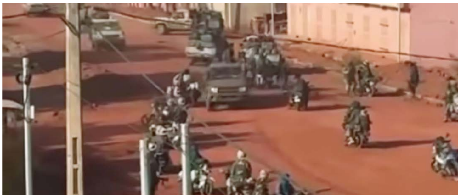
Des assaillants circulant à moto dans une ruelle de Kati, lors de l'attaque coordonnée du 25 avril 2026 contre plusieurs points stratégiques du Mali.

lité, la stratégie des groupes armés n'a pas changé. Seulement, ce qui a peut-être changé c'est l'envergure, la complexité et aussi le nombre de combattants engagés ». L'expert insiste également sur le caractère minutieux de l'opération, qui soulève des interrogations sur ses soutiens éventuels. « La simultanéité et la coordination des attaques sur des centres stratégiques comme Kati et Bamako démontrent une opération très minutieuse et très professionnelle. Cela nécessite des questionnements sur l'existence de mains invisibles derrière cette stratégie », soutient-il.