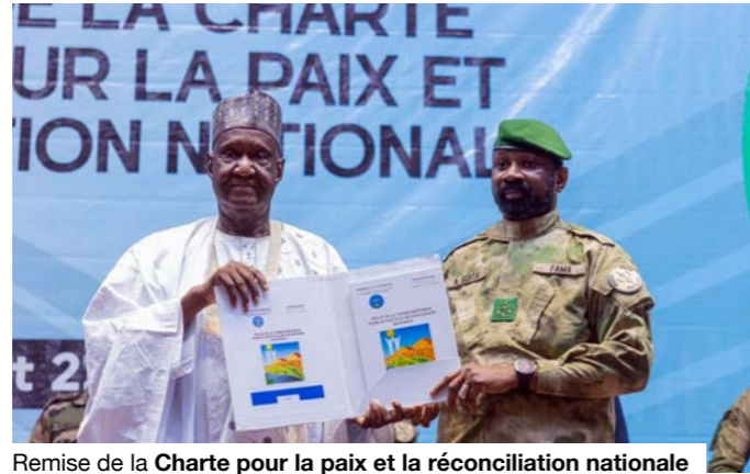
Remise de la Charte pour la paix et la réconciliation nationale au Président de la Transition.

Rattaché à la Présidence de la République, l'Observatoire est dirigé par l'ancien Premier ministre Ousmane Issoufi Maïga, avec le Général Mody Berethé comme Vice-Président. Il regroupe 30 membres issus de l'administration, du monde religieux, du secteur sécuritaire et de la société civile. La liste publiée fait apparaître 5 femmes, soit environ 17% de l'effectif, un niveau en deçà du quota de 30% prévu par la loi N°2015-052 relative à la représentation dans les instances nominatives et électives, dans un ensemble où les profils issus des grands centres urbains paraissent majoritaires.