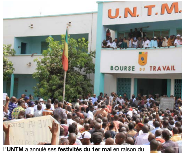
L'UNTM a annulé ses festivités du 1er mai en raison du contexte sécuritaire.