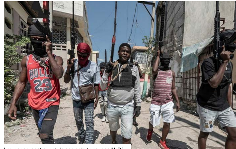
Les gangs continuent de semer la terreur en Haïti.

À Port-au-Prince, les groupes armés contrôlent une part importante de la capitale et de ses axes stratégiques, limitant les déplacements et perturbant l'activité économique. Entre janvier 2025 et mars 2026, plus de 5 500 personnes ont été tuées, tandis que le nombre de déplacés internes dépasse 1,45 million. Les enlèvements, les affrontements et les restrictions de circulation affectent durablement l'accès aux services essentiels, dans un environnement marqué par une insécurité quotidienne. Les gangs contrôlent aussi des routes-clés et imposent des taxes illégales, ce qui perturbe l'approvisionnement de la capitale.