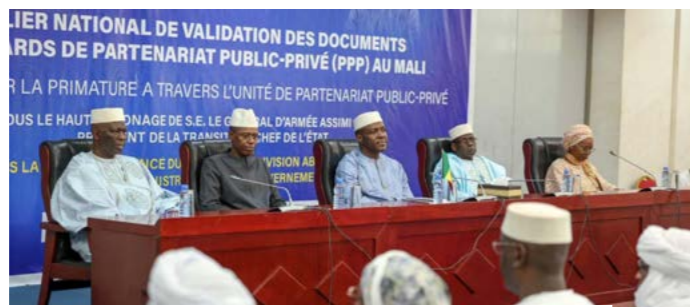
Ouverture de l'atelier national de validation des documents standards de partenariat PPP le 13 avril 2026.

La validation des documents standard de Partenariat Public-Privé (PPP) a réuni les acteurs, du 13 au 17 avril 2026, autour de l'adoption de textes dont les contrats types, les guides d'évaluation et les procédures d'appel d'offres. L'adoption de ces documents modèles constitue une étape-clé pour booster les investissements mais aussi pour assurer la transparence dans le climat des affaires. Grâce à des « règles claires et préétablies », ces documents assurent une « sécurité juridique » aux investisseurs privés, explique le Pr Daman-Guilé Diawara, spécialiste en analyse de politique économique. La standardisation permet une accélération de la réalisation en réduisant considérablement les délais, souvent très longs, pour la rédaction de contrats sur mesure pour chaque projet. L'harmonisation avec les outils standard de l'UEMOA est également une garantie de « crédibilité internationale », insiste le Pr Diawara. Depuis 2017, l'Unité PPP a permis la réalisation de 10 contrats, pour un montant de 641,178 milliards de francs CFA, dans les