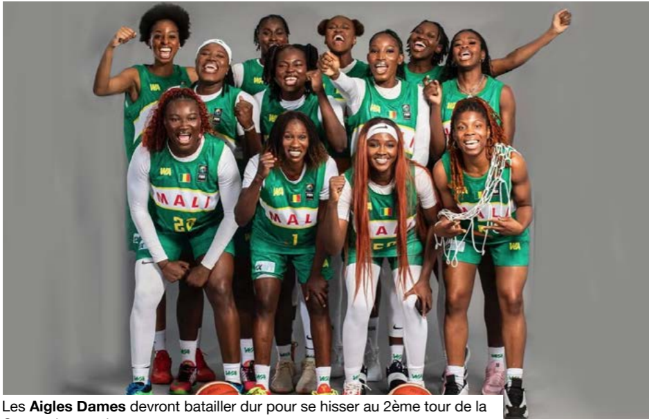
Les Aigles Dames devront batailler dur pour se hisser au 2ème tour de la Coupe du monde 2026.

Dans ce groupe A, chaque adversaire présente des arguments solides. Le Japon était déjà dans la même poule que le Mali en 2022 et s'était imposé face aux Aigles Dames (89-56). Finalistes olympiques en 2021, les Nippones arrivent avec un effectif réputé pour sa vitesse et sa maîtrise technique. Elles ont dominé leur tournoi qualifica-