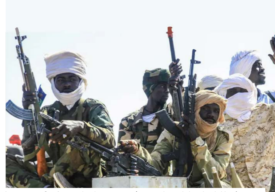
La guerre au Soudan entraîne de graves conséquences humanitaires depuis bientôt 3 ans.

Déclenchée en avril 2023, la guerre continue d'opposer l'armée du Général Abdel Fattah al-Burhan aux Forces de soutien rapide dirigées par Mohamed Hamdan Dagalo. Les combats se poursuivent notamment au Darfour et dans la capitale, Khartoum, où les infrastructures civiles, les structures de santé et les réseaux essentiels sont fortement dégradés. Pour l'heure, aucune des deux parties n'a réussi à prendre un avantage décisif. Les données disponibles illustrent l'ampleur de la crise. Plus de 34 millions de personnes ont besoin d'une assistance humanitaire. Environ 14 millions ont été