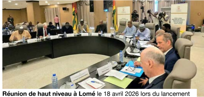
Réunion de haut niveau à Lomé le 18 avril 2026 lors du lancement de la nouvelle stratégie Togo-Sahel.

Instituée par l'Assemblée générale des Nations unies le 12 décembre 2018, la Journée internationale du multilatéralisme et de la diplomatie pour la paix rappelle le rôle du dialogue entre États, de la coopération internationale et du règlement concerté des crises. Elle a émergé dans un contexte où les cadres collectifs étaient de plus en plus interrogés sur leur efficacité face aux conflits contemporains. Dans le Sahel, ces mécanismes ont été mobilisés pendant plus d'une décennie, à travers des opérations internationales et des missions onusiennes. Leur déploiement, leurs résultats et leurs limites ont nourri les débats sur leur efficacité et leur adéquation aux réalités du terrain, ouvrant la voie à d'autres formes d'organisation politique et sécuritaire.