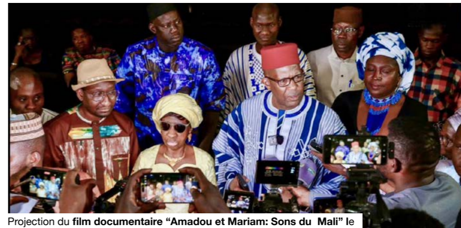
Projection du film documentaire «Amadou et Mariam: Sons du Mali» le 17 avril 2026 au Cinéma Babemba.