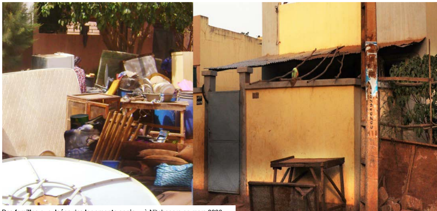
Des familles expulsées des logements sociaux à N'tabacoro en mars 2026.