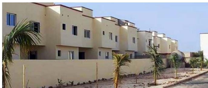
Au Sénégal, un vaste programme de construction de logements sociaux sur 10 ans est en cours.

À Senegal, les autorités ont engagé depuis plusieurs années une politique volontariste en matière de logement. Le pays s'est notamment fixé un objectif ambitieux de 500 000 logements sociaux à construire sur une période d'environ dix ans, afin de résorber un déficit structurel important et d'améliorer l'accès à l'habitat. Cette stratégie s'appuie sur des partenariats