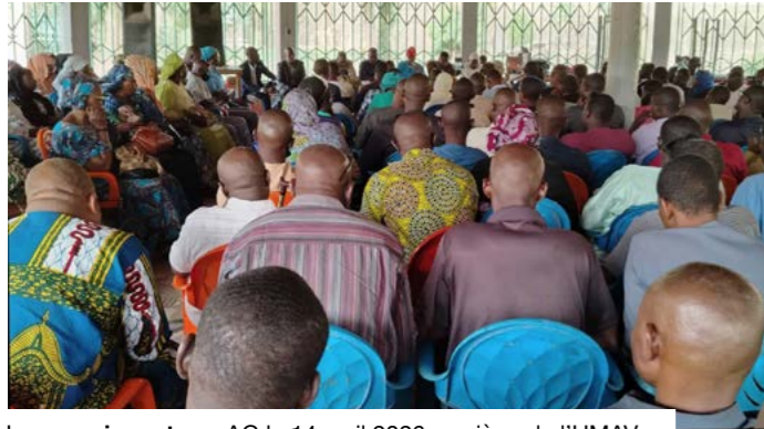
Les enseignants en AG le 14 avril 2026 au siège de l'UMAV.

La mesure continue de diviser les deux parties. Les autorités ont demandé aux concernés de regagner leurs postes initiaux, une orientation que les syndicats jugent prématurée. Les échanges engagés peinent pour l'instant à aboutir. Entre la Synergie des principaux syndicats de l'éducation et le ministère, l'apaisement reste incertain. Avant le dépôt du préavis, la Synergie avait déjà lancé des consultations et accusé les autorités de rompre le climat de confiance établi avec les syndicats. Rappelons que cette décision concerne des enseignants formés à l'École normale supérieure et affectés dans le secondaire à l'issue de leur formation continue. Leur réaffectation dans le cycle fondamental soulève des interrogations sur leur position et leur évolution professionnelle. Dans un communiqué daté du 21 avril, la Synergie annonce