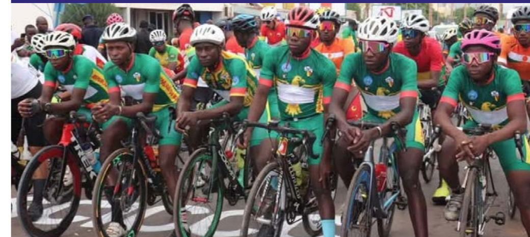
Le coup d'envoi du 12 ème Tour cycliste international du Mali a été donné à Sikasso le 14 avril 2026.