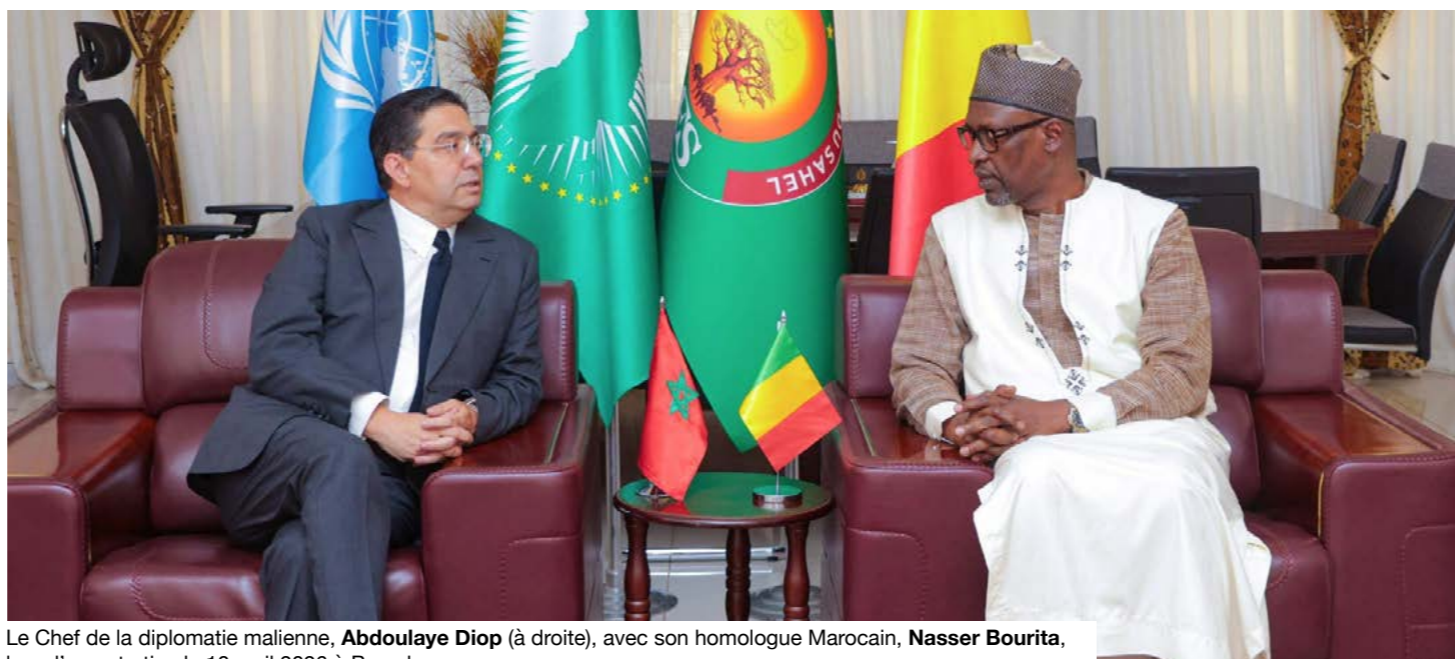
Le Chef de la diplomatie malienne, Abdoulaye Diop (à droite), avec son homologue Marocain, Nasser Bourita , lors d'un entretien le 10 avril 2026 à Bamako.

ler le cessez-le-feu et préparer un référendum. Ce scrutin n'a jamais pu se tenir, en raison de désaccords persistants sur ses modalités. Le mandat actuel de la mission court jusqu'au 31 octobre 2026. La décision prise par Bamako s'inscrit aussi dans l'évolution récente du cadre diplomatique international. La résolution 2797 du Conseil de sécurité, adoptée le 31 octobre 2025, a prolongé le mandat de la MINURSO, tout en replaçant le plan d'autonomie proposé par le Maroc au centre des discussions. Le choix de Bamako s'inscrit aussi dans une dynamique internationale plus large, le plan marocain d'autonomie bénéficiant désormais du soutien explicite de plus de 120 États, dont les États-Unis et une majorité de pays européens, ce qui renforce la portée diplomatique