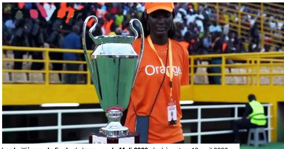
Les huitièmes de finale de la coupe du Mali 2026 s'achèvent ce 19 avril 2026.

Le coup d'envoi de ces huitièmes de finale a été donné le 10 avril avec une confrontation spectaculaire entre l'AS Real et Yeelen Olympique. Les Scorpions de Bamako ont dû puiser dans leurs ressources pour s'imposer 3-2 après prolongations, au terme d'un match intense et indécis. Le lendemain, l'USFAS a signé la performance la plus aboutie de ce tour en dominant largement l'Espérance de