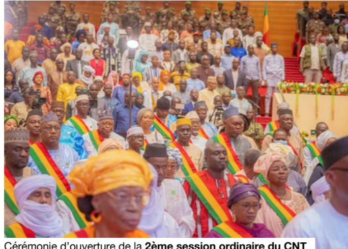
Cérémonie d'ouverture de la 2 ème session ordinaire du CNT le 13 avril 2026.

La rentrée parlementaire du CNT s'annonce particulièrement dense. Trente-deux textes sont inscrits à l'ordre du jour, dont vingt-quatre nouveaux projets et propositions de loi. Une activité soutenue qui s'inscrit dans la dynamique des réformes engagées depuis l'adoption de la Constitution du 22 juillet 2023. Dès l'ouverture, le Président du CNT, le Général Malick Diaw, a appelé à la responsabilité et à la rigueur : « l'examen de ces projets de textes dans le contexte actuel exige de chacun de nous une hauteur de vue, une rigueur institutionnelle et un sens élevé de l'intérêt supérieur de la Nation malienne », a-t-il déclaré. Une invitation à dépasser les clivages pour privilégier l'efficacité et les résultats.