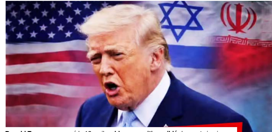
Donald Trump a annoncé le 12 avril un blocus maritime ciblé des ports iraniens.

À la suite de l'échec des discussions directes tenues à Islamabad les 11 et 12 avril, les États-Unis ont annoncé la mise en œuvre d'un dispositif de blocus maritime ciblant le trafic lié aux ports iraniens. Les navires à destination ou en provenance des installations portuaires iraniennes sont désormais concernés, tandis que la circulation vers les autres ports de la zone reste autorisée sous surveillance renforcée. Cette décision intervient après 21 heures de pourparlers entre délégations américaine et iranienne qui se sont achevés sans accord. Le dossier nucléaire