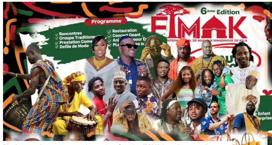
Plusieurs artistes sont attendus sur la scène du FIMAK jusqu'au 19 avril 2026.

Le Palais de la Culture accueille cette sixième édition qui réunit durant une semaine artistes, artisans, communicateurs traditionnels et amateurs de musique. Le festival s'affirme comme une plateforme d'expression artistique et culturelle, de rencontres et d'échanges entre la musique mandingue dans toute sa richesse et d'autres sonorités venues d'ailleurs. Initié par Kaira Management Global,