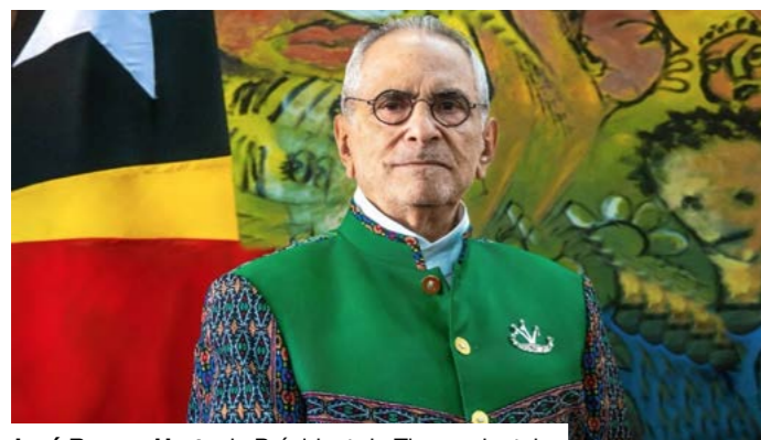
José Ramos Horta, le Président du Timor oriental.

Ancienne colonie portugaise, le territoire connu un tournant majeur en 1975, lorsque le Portugal s'en retira dans un contexte d'instabilité. La même année, l'Indonésie intervint militairement et intégra le Timor oriental à son territoire. Le dossier demeura