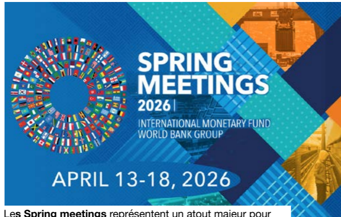
Les Spring meetings représentent un atout majeur pour l'économie malienne.

Le premier enjeu tient à la croissance. Le FMI, qui a validé le 18 mars 2026 la seconde et dernière revue du programme de référence, estime que l'économie malienne pourrait rebondir entre 5, % et 5,5% en 2026, après un ralentissement à 4,1% en 2025, lié à la baisse de la production d'or et aux perturbations d'approvisionnement en carburant. Cette amélioration dépendra toutefois du redressement minier, de la fluidité des corridors logistiques et d'une stabilisation du climat sécuritaire. L'autre sujet concerne les finances publiques. Le FMI souligne que le budget 2026 reste orienté vers le respect de la norme communautaire de l'UEMOA, avec un déficit attendu autour de 3% du PIB. Cette trajectoire demeure sous pression, entre dépenses sécuritaires, besoins sociaux et soutien à l'énergie. Le rendez-vous de Washington sera donc scruté pour la capacité du pays à préserver ses marges budgétaires tout en soutenant la reprise. La mobilisation fiscale, avec près de 1 400 milliards de