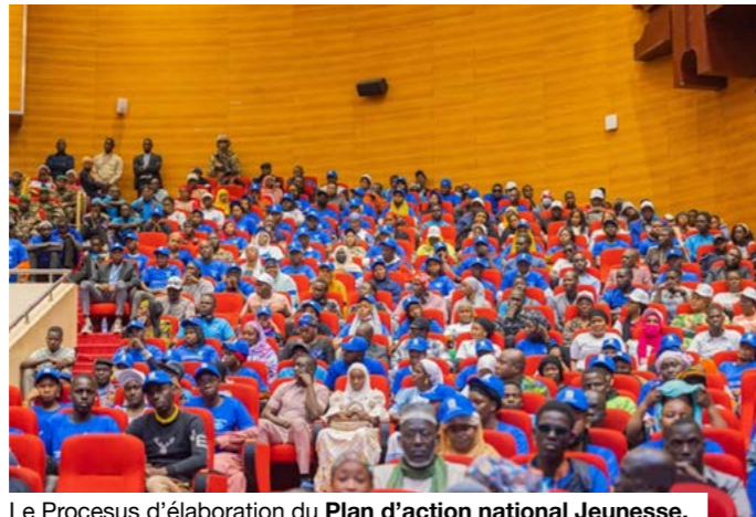
Le Processus d'élaboration du Plan d'action national Jeunesse, paix et sécurité est en cours.

Dans un pays où près de 67% de la population a moins de 25 ans, la question dépasse largement le champ de la jeunesse au sens administratif. Chômage, ruptures scolaires, déplacements forcés et manque de perspectives nourrissent un terrain fragile, particulièrement dans les zones touchées par l'insécurité. Plus de 400 000 personnes demeurent déplacées à l'intérieur du pays, avec une forte proportion de jeunes et d'enfants. Les jeunes paient aujourd'hui le plus lourd tribut à la crise : premières victimes des déplacements, de la déscolarisation et des violences, ils sont aussi les premières cibles des stratégies de recrutement des groupes armés. Les Nations unies ont pourtant fixé le cap depuis 2015 avec la Résolution 2250, renforcée en 2018 par la Résolution 2419, qui reconnaissent les jeunes comme des acteurs de paix, de médiation et de reconstruction. Le Mali adhère à cette vision, mais la traduction institutionnelle est encore incomplète.