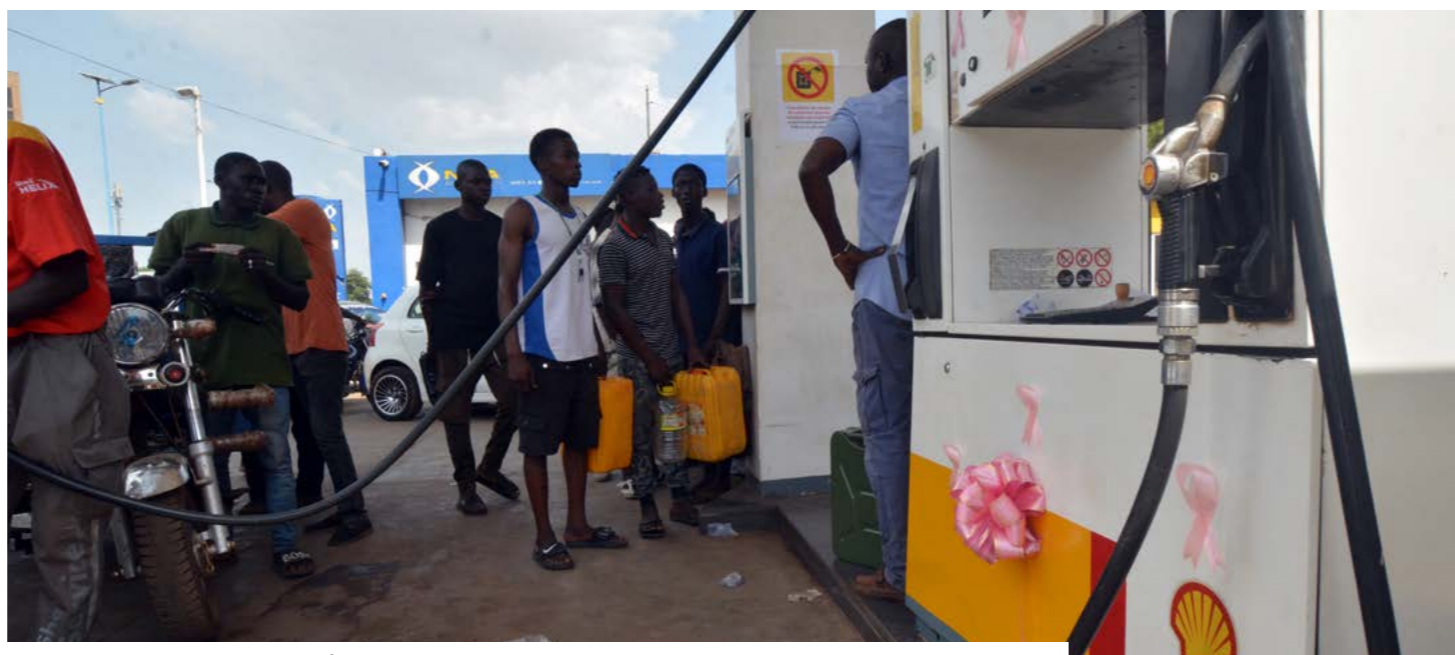
Le coût du carburant a augmenté depuis le 28 mars 2026, entraînant une hausse multisectorielle des prix.

taires pourrait maintenir les prix mondiaux des denrées entre 15 et 20% au-dessus de leur niveau moyen du premier semestre si la crise au Moyen-Orient se prolonge. Pour faire face à ces défis et assurer la continuité des activités et services vitaux, les autorités ont décidé de constituer un stock national de sécurité couvrant 45 jours de consommation pour le supercarburant, le gasoil, le Jet A1 et le gaz butane. Rendre ces dispositions opérationnelles dépendra non seulement de l'évolution de la crise au plan international, mais également des mesures d'accompagnement prévues, notamment un plan d'appro-