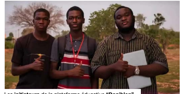
Les initiateurs de la plateforme éducative "Doniblon".

Derrière cette initiative se trouve une équipe de jeunes entrepreneurs maliens, encore peu connus du grand public, mais profondément engagés. Leur ambition est de créer un cadre dans lequel les jeunes peuvent acquérir des compétences concrètes, développer leur créativité et envisager un avenir professionnel autonome. Leur démarche repose sur une forte conviction : « l'éducation ne doit pas être uniquement académique, mais aussi pratique, culturelle et adaptée au contexte local ». Les activités proposées par Doniblon couvrent plusieurs domaines, notamment les arts, les métiers et l'entrepreneuriat. Théâtre, expression orale, formations pratiques ou encore accompagnement de projets : autant d'outils mobilisés pour