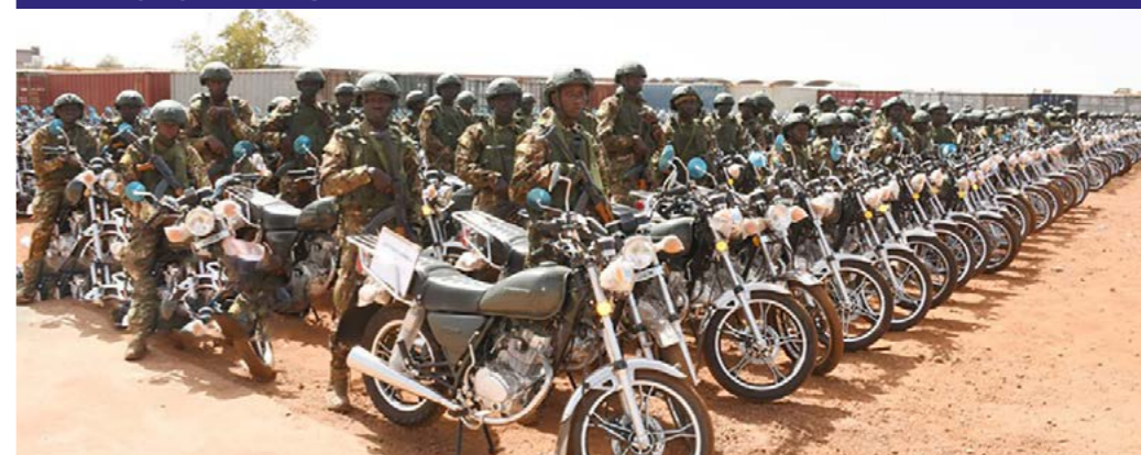
Le chef d'État-Major a remis un lot de 2 000 motos à plusieurs groupements tactiques interarmes dans le cadre de la lutte contre le terrorisme, ce 7 avril 2026.