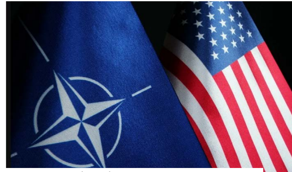
Donald Trump et ses alliés européens de l'OTAN ne parlent plus le même langage.

La trêve provisoire annoncée entre les États-Unis, l'Iran et Israël a pour l'instant éloigné le risque d'un embrasement régional. Mais elle n'a pas refermé la fracture diplomatique ouverte ces derniers jours entre Washington et plusieurs capitales européennes. Donald Trump a ravivé les interrogations sur l'engagement américain au sein de l'OTAN, reprochant à certains alliés leur refus de s'engager davantage dans la sécurisation du détroit d'Ormuz et des voies maritimes énergétiques. Cette accalmie de deux semaines, saluée avec prudence à Bruxelles, ne dissipe ni les tensions accumulées ni les doutes sur la place