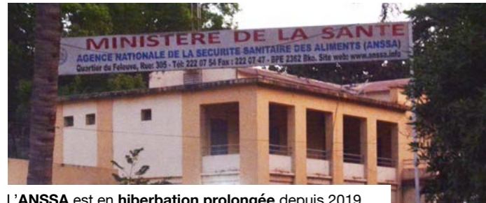
L'ANSSA est en hibernation prolongée depuis 2019.

Créée en 2003 pour garantir la sécurité sanitaire des aliments au Mali, l'ANSSA constituait un maillon essentiel du dispositif national de santé publique. Unique dans l'espace UEMOA, elle assurait à la fois le contrôle, la surveillance et l'amélioration de la qualité des produits alimentaires destinés à la consommation. Mais, en 2019, la réforme ayant conduit à la création de l'Institut national de santé publique (INSP) a profondément bouleversé son fonctionnement. L'ANSSA a alors été fusionnée avec cette structure d'analyses et de recherche, une décision contestée par ses travailleurs, qui estimaient que les missions de l'agence, centrées sur l'agroalimentaire, différaient fondamentalement de celles de l'INSP.