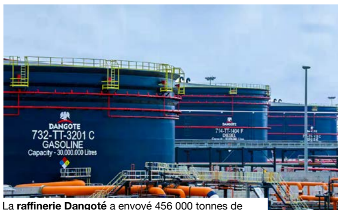
La raffinerie Dangoté a envoyé 456 000 tonnes de produits raffinés vers plusieurs pays africains.

Dans plusieurs pays de la sous-région, les prix du carburant ont augmenté. En cause : les tensions autour du détroit d'Ormuz, liées à la crise opposant les États-Unis et Israël à l'Iran. Au Nigeria, le prix du litre d'essence a atteint 0,90 dollar (environ 505 francs CFA) en mars, contre 0,76 dollar (environ 427 francs) en février