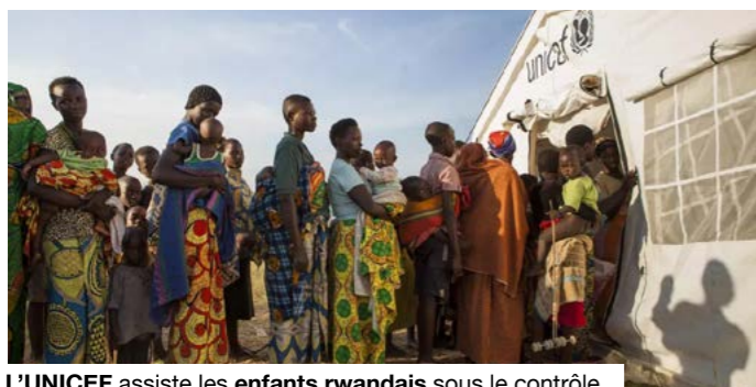
L'UNICEF assiste les enfants rwandais sous le contrôle gouvernemental.

Souvent cité parmi les modèles africains en matière de gouvernance publique, le Rwanda a progressivement mis en place un dispositif qui lui permet de garder la maîtrise des financements venus de l'extérieur tout en maintenant un espace opérationnel pour les ONG, les fondations et les partenaires de l'aide. Le choix fait par les autorités