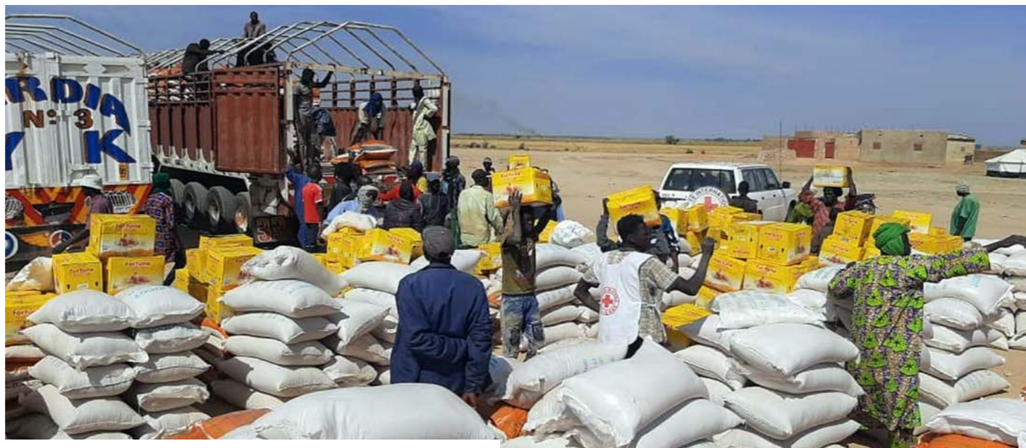
Distribution de vivres aux populations vulnérables par le CICR à Gao.