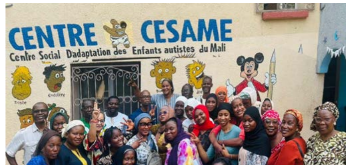
Le Centre Césame est dédié à la prise en charge des enfants autistes depuis 2024.

Instaurée par l'ONU en 2007, cette journée vise à promouvoir les droits, l'acceptation et l'inclusion des personnes autistes. Au Mali, les associations créées par des parents d'enfants autistes mènent des actions de sensibilisation pour mieux faire connaître ce trouble du neurodéveloppement et réduire la marginalisation qui touche encore de nombreuses familles. Une étude menée par l'association Autisme Mali en 2014 faisait état d'une prévalence de 4,5% au sein des cas recensés dans les structures de santé étudiées. Elle relevait aussi que 88,6% des enfants identifiés n'étaient pas scolarisés. Depuis, l'association poursuit ses efforts à travers « Autisme Tour », une caravane annuelle destinée à sensibiliser le grand public et les soignants, encore souvent peu familiarisés avec le diagnostic. Selon l'Organisation mondiale de la santé, le repérage précoce et l'accompagnement éducatif restent les leviers les