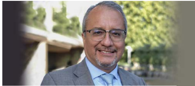
Eduardo Gonzalez, expert indépendant des Nations-Unies sur les droits humains au Mali.

Le rapport que j'ai présenté au Conseil des droits de l'Homme est le fruit d'une enquête minutieuse au cours de laquelle j'ai sollicité à plusieurs reprises la collaboration des autorités maliennes. En effet, le 24 septembre 2025, j'ai adressé au gouvernement une lettre accompagnée d'un questionnaire détaillé afin de recueillir son point de vue sur la situation des droits de l'Homme dans le pays, mais je n'ai reçu aucune réponse. De même, le projet de mon rapport a été remis au gouvernement le 18 décembre 2025 afin de recueillir ses observations et suggestions, mais là encore je n'ai reçu aucune réponse. Ce n'est que le 27 janvier 2026, alors que le texte avait déjà été remis pour traduction, que j'ai reçu un document de réponse que j'ai remercié le gouvernement d'avoir fourni et que j'ai publié en annexe du rapport. Le gouvernement malien répond de trois manières : premièrement, il critique la méthodologie du rapport en affirmant qu'elle repose sur des informations non confirmées. Deuxièmement, il nie les faits en indiquant, entre autres, que le gouvernement n'a pas adopté de mesures liberticides, que les forces armées n'attaquent pas de cibles civiles, qu'il n'y a jamais eu de présence du groupe « Wagner » au Mali, que de nombreux procès sont menés contre les violations des droits de l'Homme et que le rapport exagère la gravité de la situation. Troisièmement, le gou-