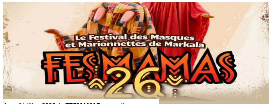
Avec l'édition 2026, le FESMAMAS poursuit sa mue.

Cette édition vise à concilier modernité organisationnelle et valorisation d'un patrimoine culturel profondément ancré dans les traditions locales. Porté par une approche plus structurée, le festival se distingue cette année par une implication accrue des communautés locales, désormais organisées en coopératives. Ce choix traduit la volonté de renforcer l'ancrage territorial de l'événement et de mieux garantir la transmission des savoirs. Parallèlement, le FESMAMAS poursuit son ouverture au numérique avec la diffusion en direct de ses temps forts, permettant à un public élargi de vivre l'expérience à distance.