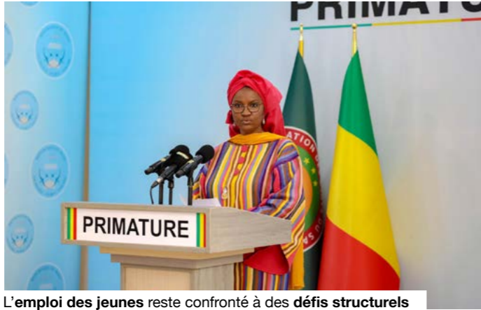
L'emploi des jeunes reste confronté à des défis structurels malgré les chiffres globaux encourageants.

La ministre en charge de l'Emploi et de la Formation professionnelle, Oumou Sall Seck, a présenté un bilan jugé encourageant, mettant en avant la création de 65 503 emplois nets en 2025, dont 40 566, soit 59%, relèvent du secteur public. Si ce chiffre traduit une dynamique réelle, il reste inférieur au flux annuel des nouveaux entrants sur le marché du travail, estimé à plus de 235 000 jeunes par an selon plusieurs analyses internationales. Le Mali demeure confronté à des défis structurels persistants : forte croissance démographique, urbanisation rapide, accès inégal aux services sociaux de base et pression croissante sur les ressources économiques. Dans ce contexte, la jeunesse continue de rechercher des emplois décents et productifs dans un marché encore dominé par l'informel. Selon la Banque mondiale, près de 90% des actifs maliens exercent dans l'économie informelle, souvent sans protection sociale ni stabilité de revenu. Comme le soulignent Daman-Guilé Diawara, Amidou Ballo et Boubacar Bagayoko dans « Enseignement supérieur et